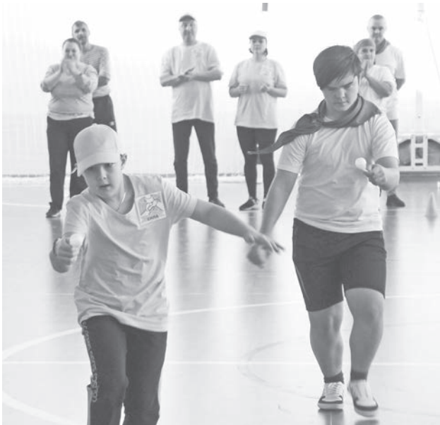
Соревнования прошли на одном дыхании, в дружеской, весёлой атмосфере.

Главный итог спортивного праздника – это ещё одна возможность собраться детям и взрослым вместе, проявить стремление в достижении общей цели. Он надолго останется в памяти ребят и их родителей. А завершились соревнования общим танцем.