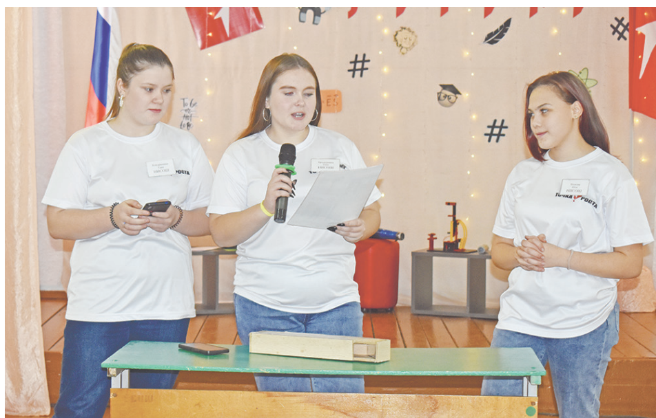
Команда из Нижней Иленки изготовила перископ.

стало изготовление оптических приборов. На суд жюри были представлены калейдоскоп, микроскоп, подзорная труба, перископ. Каждая команда продемонстрировала свой прибор и рассказала о принципе его работы.