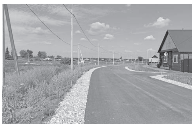
Новая высоковольтная линия в Сапегиной.

Люди, которые работают в этой отрасли, несмотря на все сложности, являются высокопрофессиональными