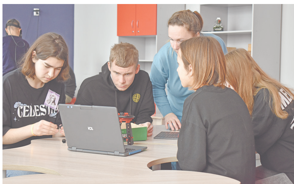
Участникам было предложено несколько мастер-классов.