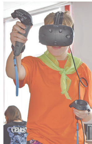
Ребята попробовали на себе шлем виртуальной реальности.