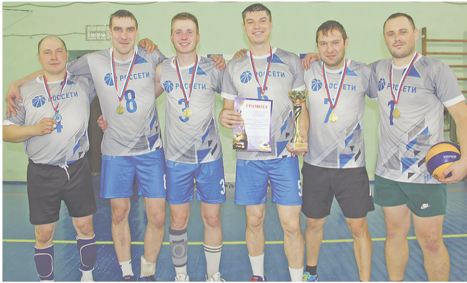
Команда «Байкаловский РЭС» – победители турнира.

Своеобразный финал между Чурманом и БРЭСом был захватывающим, эмоциональным и держал в напряжении до финального свистка.