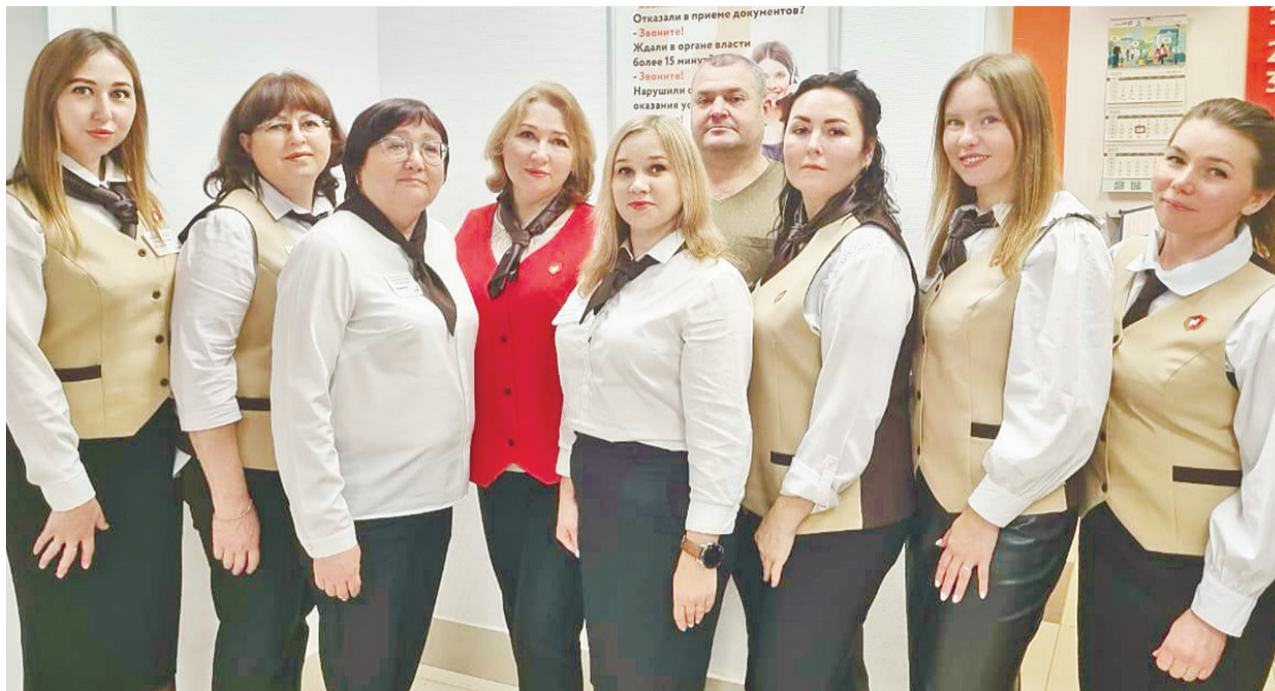
В отделе МФЦ – дружный и сплочённый коллектив.

с ним можно ознакомиться на сайте МФЦ. Необходимо отметить, что всё это бесплатно, за исключением случаев, когда предусмотрена госпошлина.