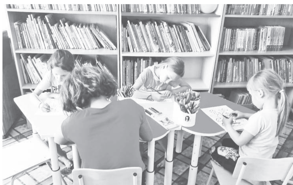
В библиотеке детям всегда найдётся занятие по душе.

И сейчас одна из актуальных проблем местных жителей – это пустые полки в этом магазине, где нет элементарных товаров и продуктов. Что говорить, даже хлеб стали привозить реже и в меньшем количестве. Если редко на прилавках появляется какое-то печенье к чаю и в холодильниках, кроме маргарина, есть что-то ещё – это можно