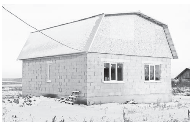
Люди продолжают строиться – значит, деревня живёт.