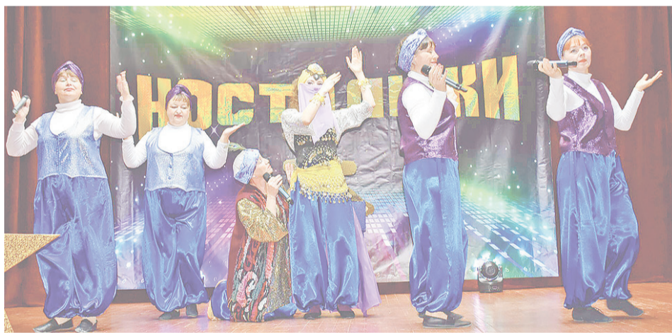
Вокальная группа «Россияна».

Ретро-фестиваль радует нас уже много лет,