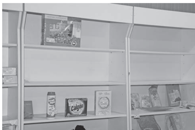
Одна из актуальных проблем – пустые полки и холодильники в магазине.