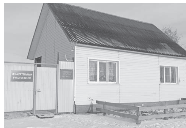
Библиотека – единственное место в Гуляевой, где организуют досуг детей.