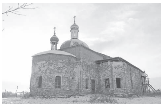
О былом величии Гуляевой говорит возвышающийся храм.