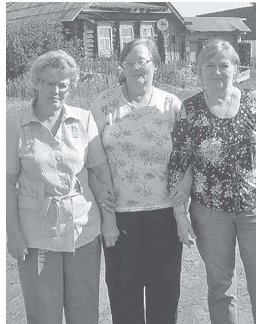
С сёстрами на Родине.