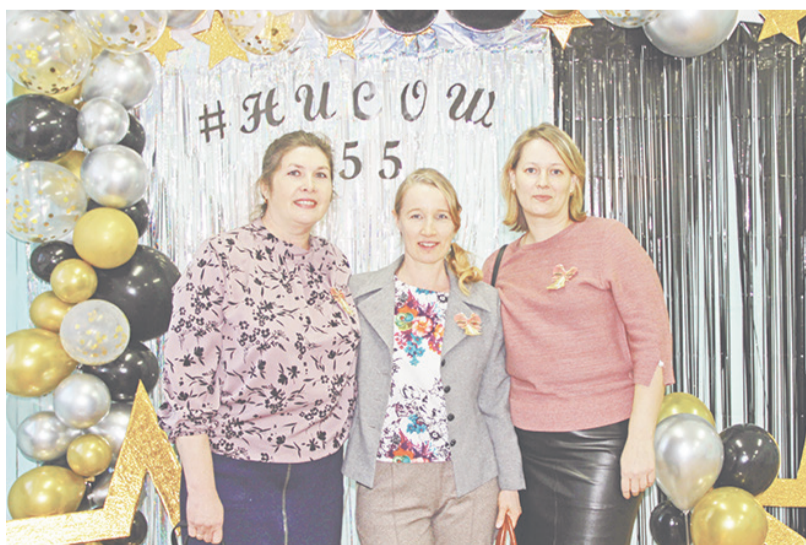
Разделить радость торжества с родной школой пришли выпускники разных лет.

теля, ученики, родители, выпускники и даже гости. Этот дом сложился, как по кирпичику, из наших дел, наших качеств, талантов и старания. Каждый внёс что-то своё. И хочется ве-