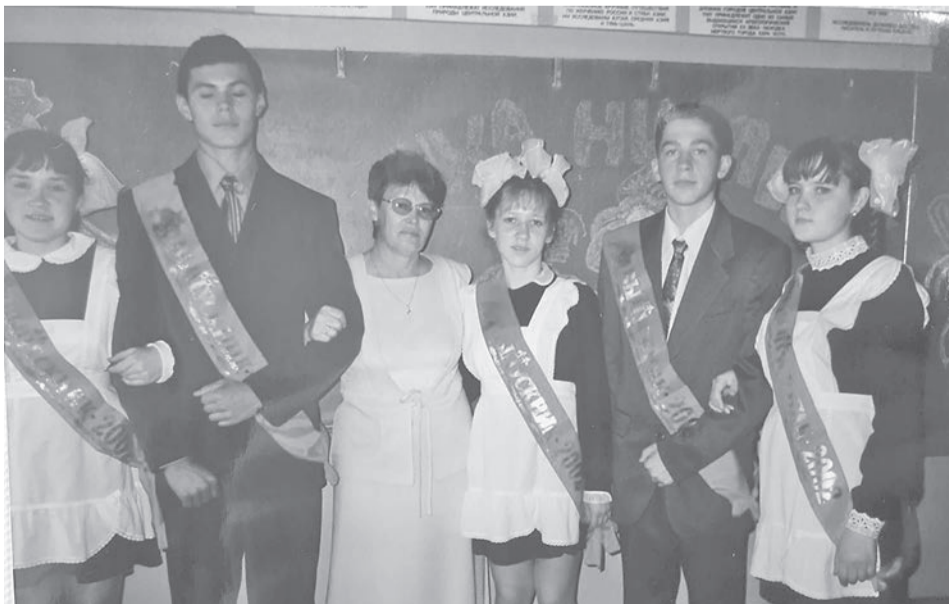
2002 год. Провожая своих выпускников...