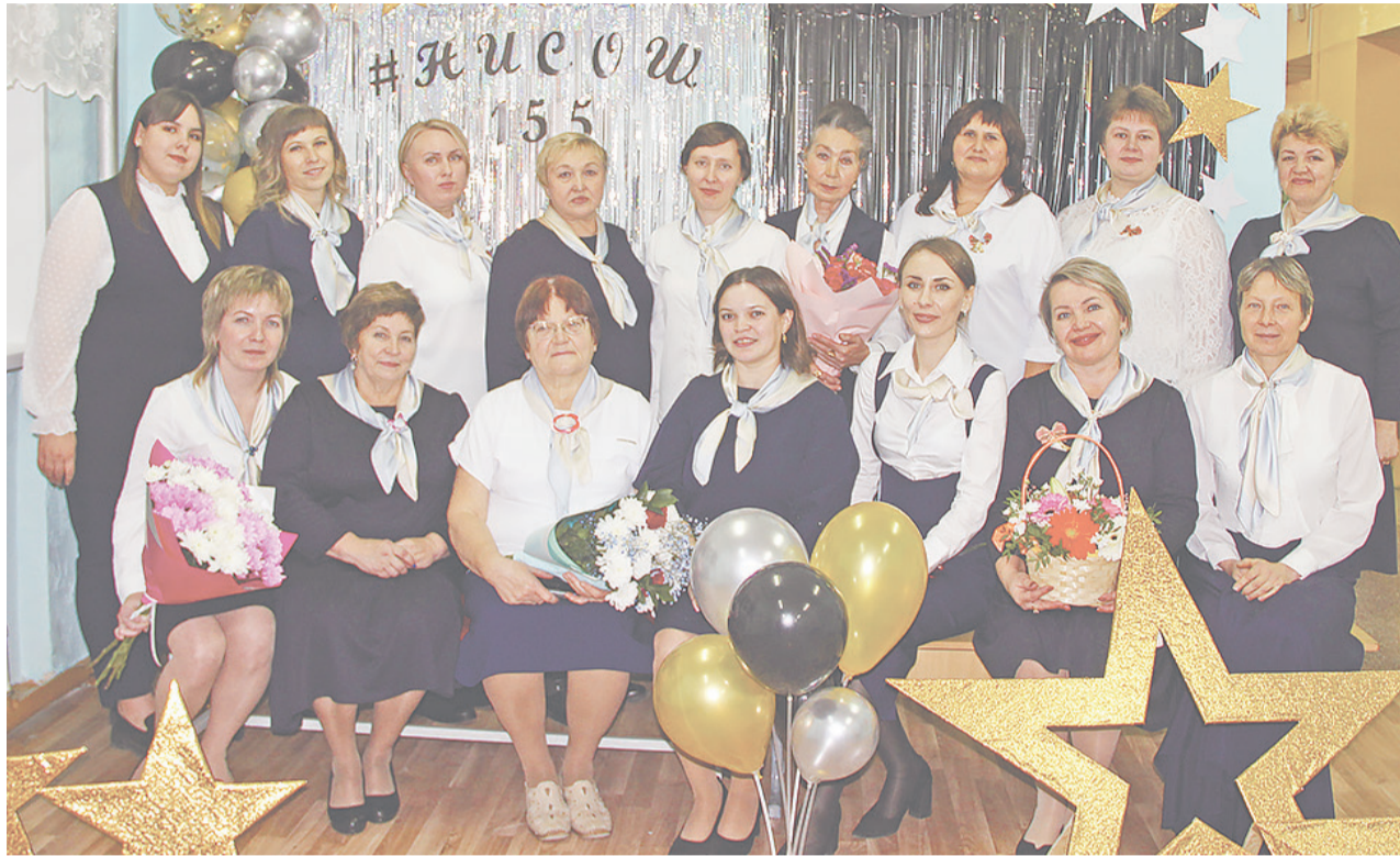
Педагогический коллектив Нижне-Иленской школы.

2023 года, эти ребята совсем недавно выпорхнули из стен родной школы.