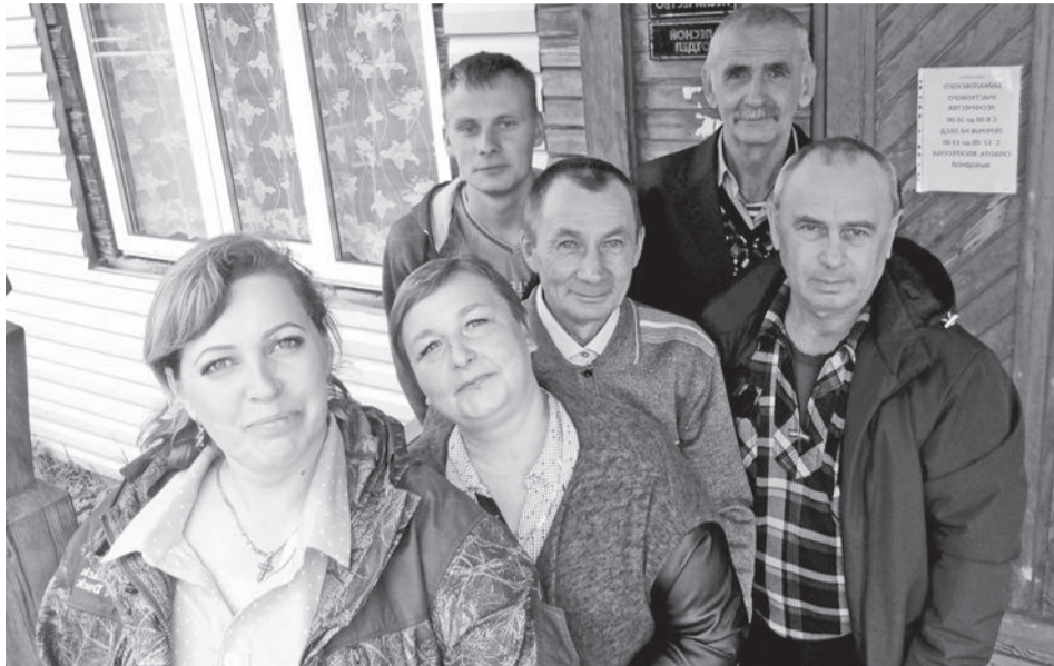
Коллектив Байкаловского участкового лесничества и Авиабазы.

могал техникой, подвозом воды, добровольцам на всех «фронтах» – в Комлевой, Захаровой, Инишевой. Спасибо вам огромное!