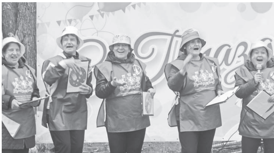
Команда «Комета» из Пелевиной – победитель турслёта.