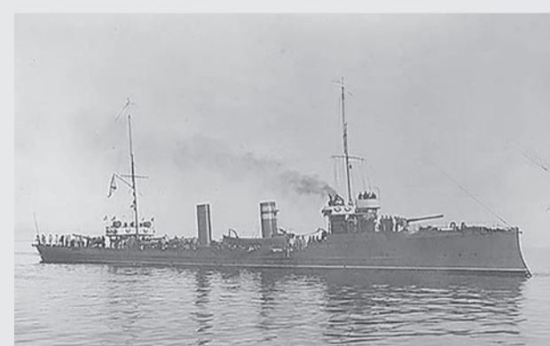
Эскадренный миноносец «Донской казак». Фотография из альбома, хранящегося в Новочеркасском музее истории Донского казачества.

22 августа 1917 года. Эскадренный миноносец «Донской казак», подбирая в Ирбенском проливе вблизи от места гибели эскадренного миноносца «Доброволец» всплывшие трупы погибших, подорвался кормой на mine. Благодаря крепости кормовой переборки машинного отделения, выдержавшей давление воды, миноносец остался на плаву и был отбуксирован эскадренным миноносцем «Стережущий» к Вердеру. При взрыве было