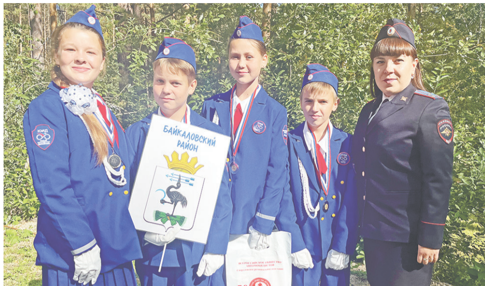
Нижнеиленские школьники второй год подряд участвуют в областных соревнованиях.

стрировали знания правил дорожного движения, умения оказания первой доврачебной помощи, творческие и навыки управления велосипедом, в том числе в условиях движения по импровизированной проезжей части с раз-