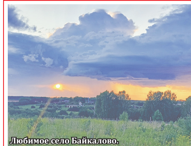
Любимое село Байкалово.