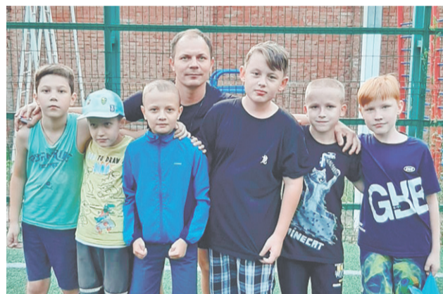
Преуспели и в футболе!