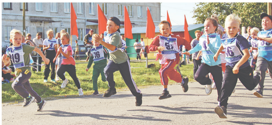
Воспитанники детских садов пробежали 500 метров.

С утра центр деревни был украшен флагами, звучала бодрящая музыка. На дороге нанесена специальная разметка, установлены аншлаги – «старт», «финиш». На регистрации очередь. Лучшие атлеты Баженовского сельского поселения записываются в свои возрастные группы и получают номера с сим-