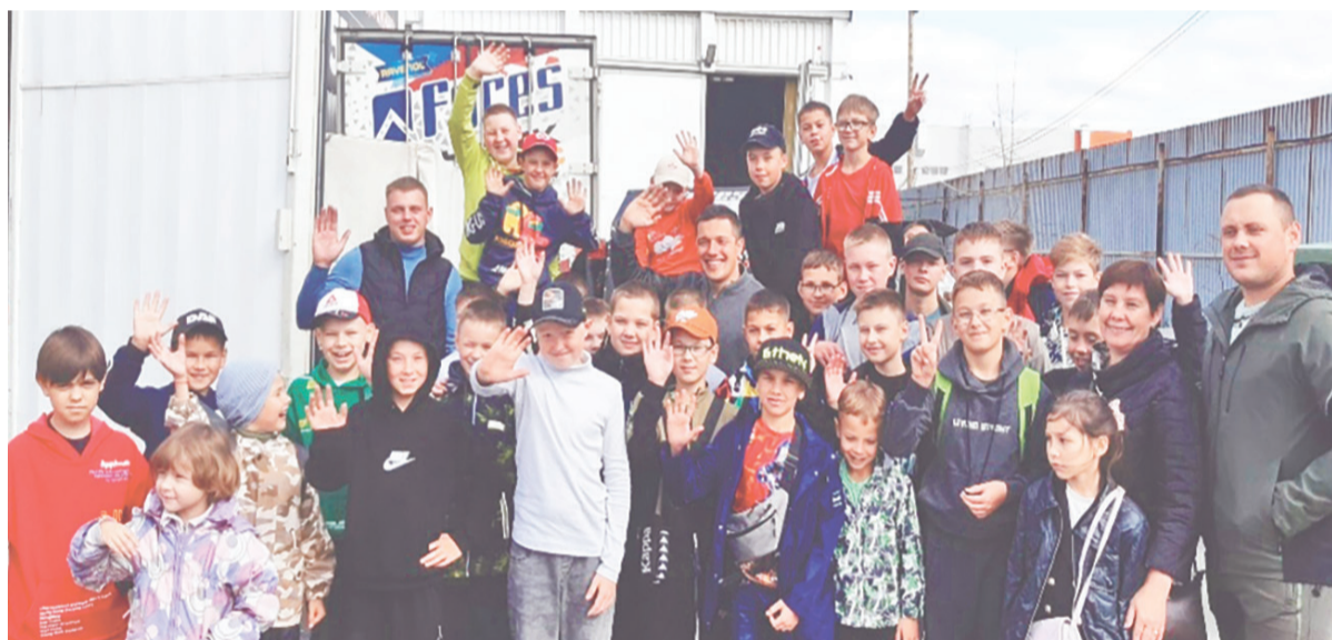
Ребята в восторге от поездки.