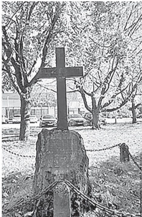
Братская могила русских моряков в городе Хаапсалу.

Данная информация заинтересовала многих жителей территории, кто хоть как-то причастен к деревне Инишевой и роду Долматовых данной деревни. Интерес вызвал не только срок давности событий,