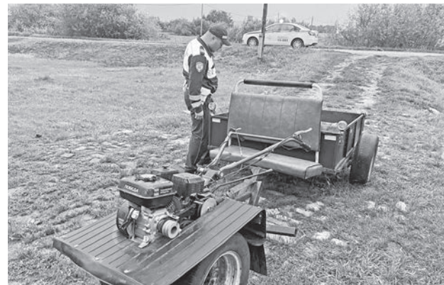
Мотоблок на дороге – опасная вещь.

Уважаемые участники дорожного движения! Отдел Госавтоинспекции МО МВД России «Байкаловский» напоминает: мотоблок – это агрегат, предназначенный для сельскохозяйственных работ. Управление мотоблоком по дорогам общего пользования опасно для жизни. Согласно статистике, лица, находящиеся на мотоблоке, в результате ДТП наносят тяжкий вред здоровью либо получают травмы, несовместимые с жизнью. Госавтоинспекция убедительно просит отказаться от управления мотоблоками в состоянии опьянения, не перевозить в прицепах детей. Берегите себя, близких и других участников движения, которые вас окружают.