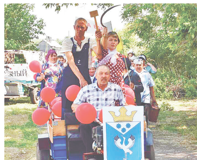
Настоящее украшение деревни – это люди.