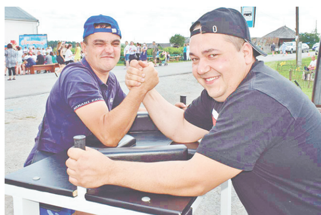
Были организованы и спортивные состязания.