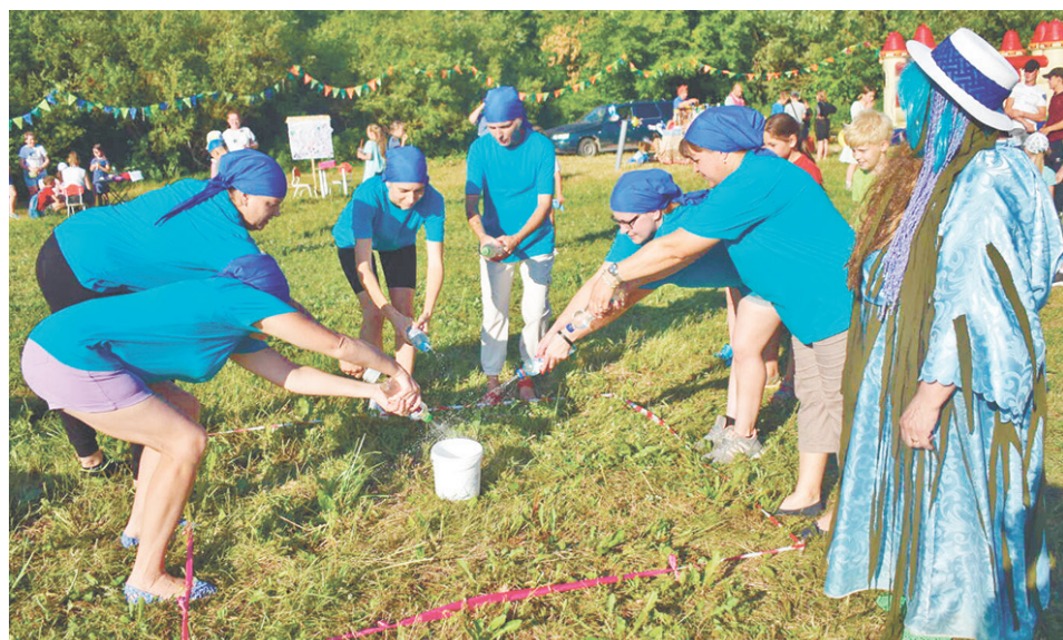
По традиции все конкурсы в этот день были связаны с водой.