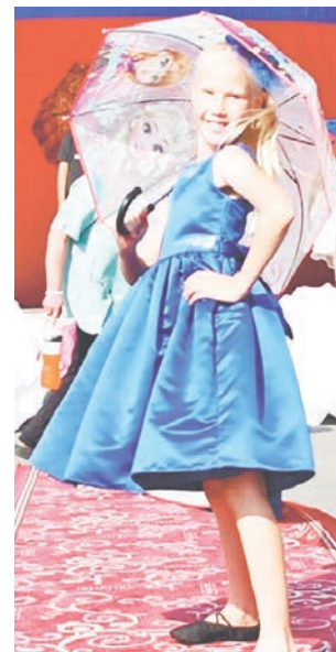
Лица участников сияли.

1 июля природа подарила солнечный день, лица присутствующих на празднике тоже сияли. Собралась одна большая дружная семья – коллективы Вязовской школы, детского сада, агрофирмы «Байкаловская», Вязовской ОВП, Дома культуры, совет вете-