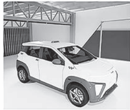
Возможность зарабатывать в том числе не только в такси

В числе победителей проект Надежды Шимовой «Фабрика», направленный на использование инфраструктуры техникумов на нужды производства критичной для страны продукции. Суть идеи состоит в организации учебно-производственного процесса с привлечением студентов к изготовлению дронов, которые смогут садиться на провода ЛЭП, заряжаться от них и выполнять диагностику, техобслуживание и ремонт. Пилотный проект по производству дронов планируется запустить на базе Уральского политехнического колледжа в Технопарке «Университетский». Уже в 4 квартале текущего года планируется выйти на объём производства до 100 дронов в месяц.