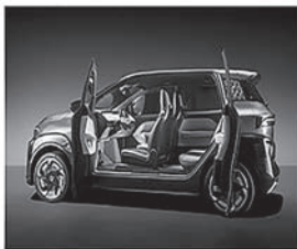
Возможность передвигаться в том числе на дальние расстояния (туризм)