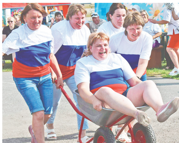
Юмористическая спортивная эстафета.