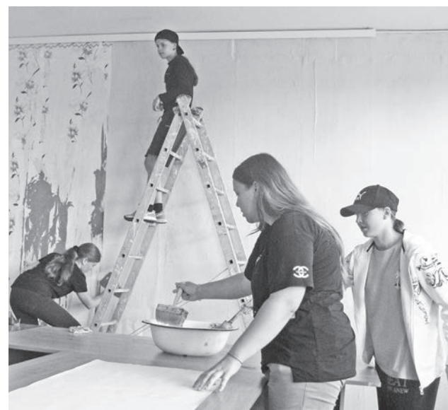
Дети активно помогают в ремонте школы.

Каникулы – каникулами, а школьная жизнь продолжается, кипит и бурлит.