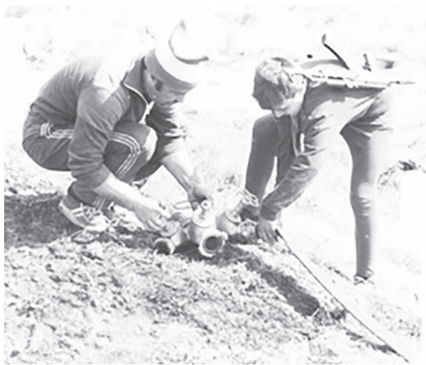
Соединение пожарного рукава.

Было тяжело. Иногда хотелось поддаться лени и пропустить тренировку, но мы боролись с собой и упорно продолжали подготовку. И был результат. Очень часто наша команда оказывалась в призах, занимала первые места. Мы были победителями!»