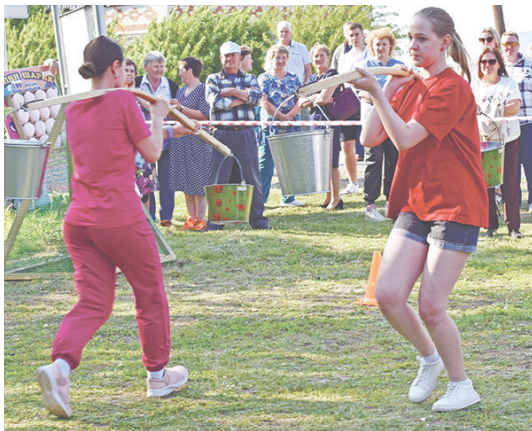
«Женские спортивные старты» прошли на ура.

Все спортивные состязания вызвали интерес болельщиков. Эмоционально прошёл