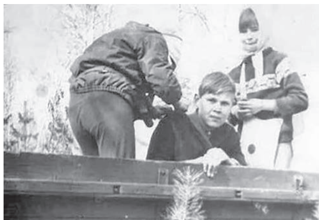
Оказание первой помощи.