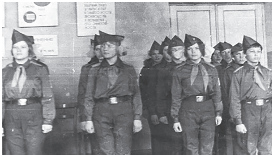
Отряд «Алые паруса».