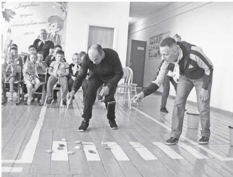
С ребятами играют папы и дедушки.

в 8.30 утра, но ребята приходят раньше – им не терпится заняться увлекательным делом. В начале каждой недели – обязательное поднятие флага.