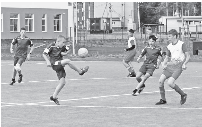
Болельщики могли увидеть красивый футбол.