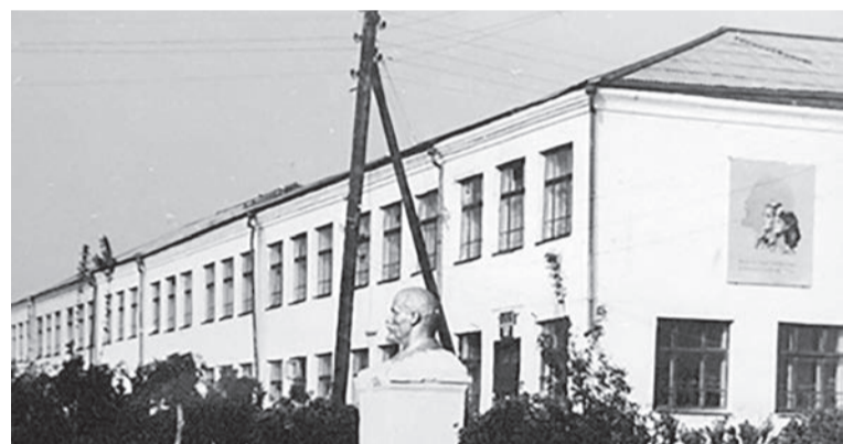
1939-1940 учебный год. Построено двухэтажное каменное здание школы.