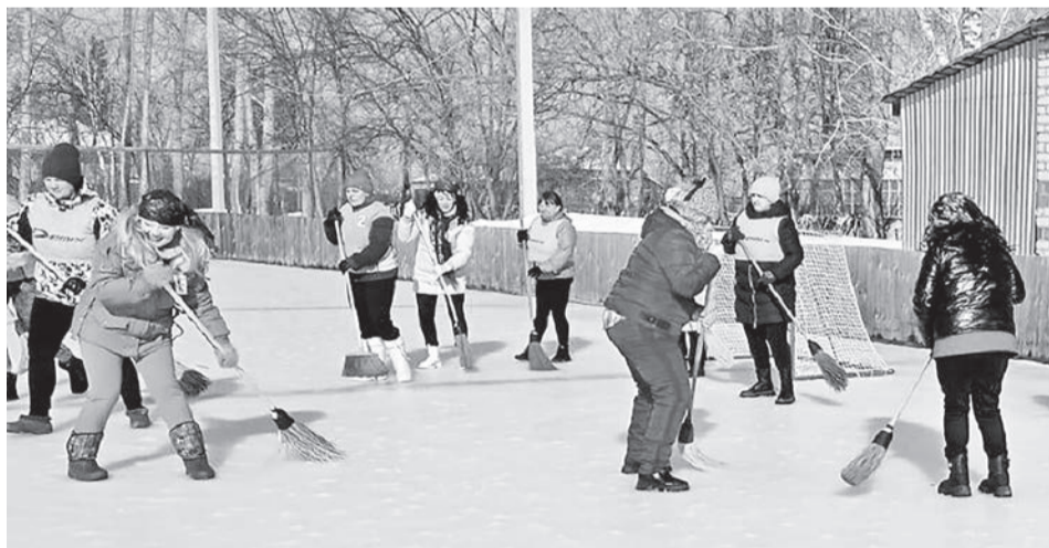
Женщины, вооружённые мётлами, собрались лишь для того, чтобы «сделать отличную игру» и обеспечить настроение.

уморительно-комичными, а игроки при этом получали болезненные ушибы, ни одна из участниц не покинула «поле боя».