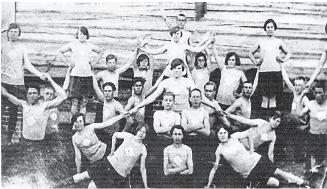
Школьный коллектив «Красная рубаша» прославился тем, что ребята высмеивали в своих выступлениях тунеядство, жадность, лень.