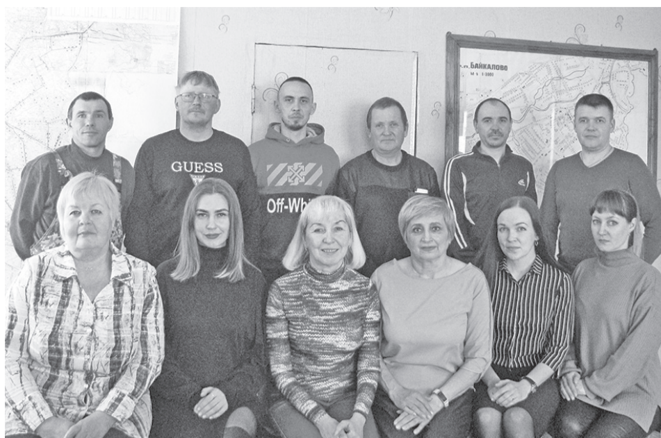
Коллектив МУП ЖКХ «Тепловые сети».

Свой нынешний статус МУП ЖКХ «Тепловые сети» обрело в 2009 году. До этого именовалось по-разному, но неизменным оставалось главное – оказание жилищно-коммунальных услуг. И сегодня его основные функции прежние: обеспечивать жилые и рабочие помещения водой и теплом во время зимнего отопительного сезона.