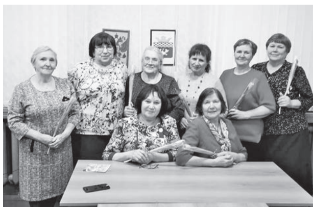
После поздравления у женщин глаза светились, душа радовалась.