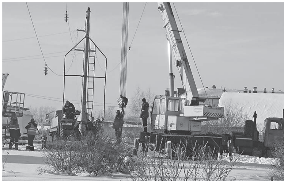
Замена повреждённой опоры на улице Павлика Морозова.