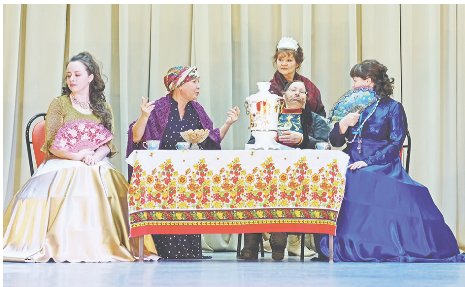
Пьеса «Семейная картинка», Ляпуновский ДК.