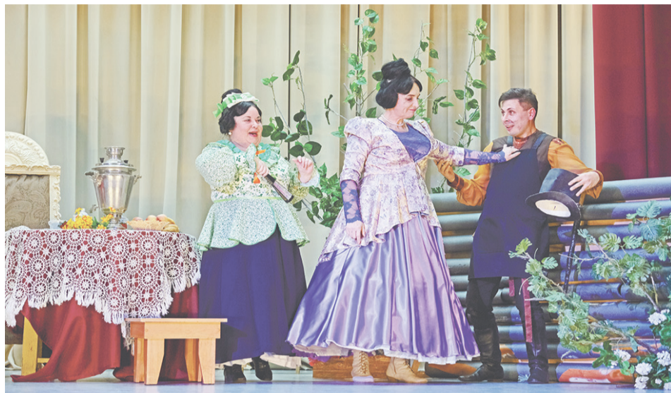
«Женитьба Бальзамина», Байкаловский ЦДК.

При жизни знаменитый писатель Алексей Николаевич написал около 50 пьес. Ляпуновский ДК представил отрывок из его пьесы «Семейная картинка», Пелевинский – из «Снегурочки», Байкаловский ЦДК – из «Женитьбы Бальзамина».