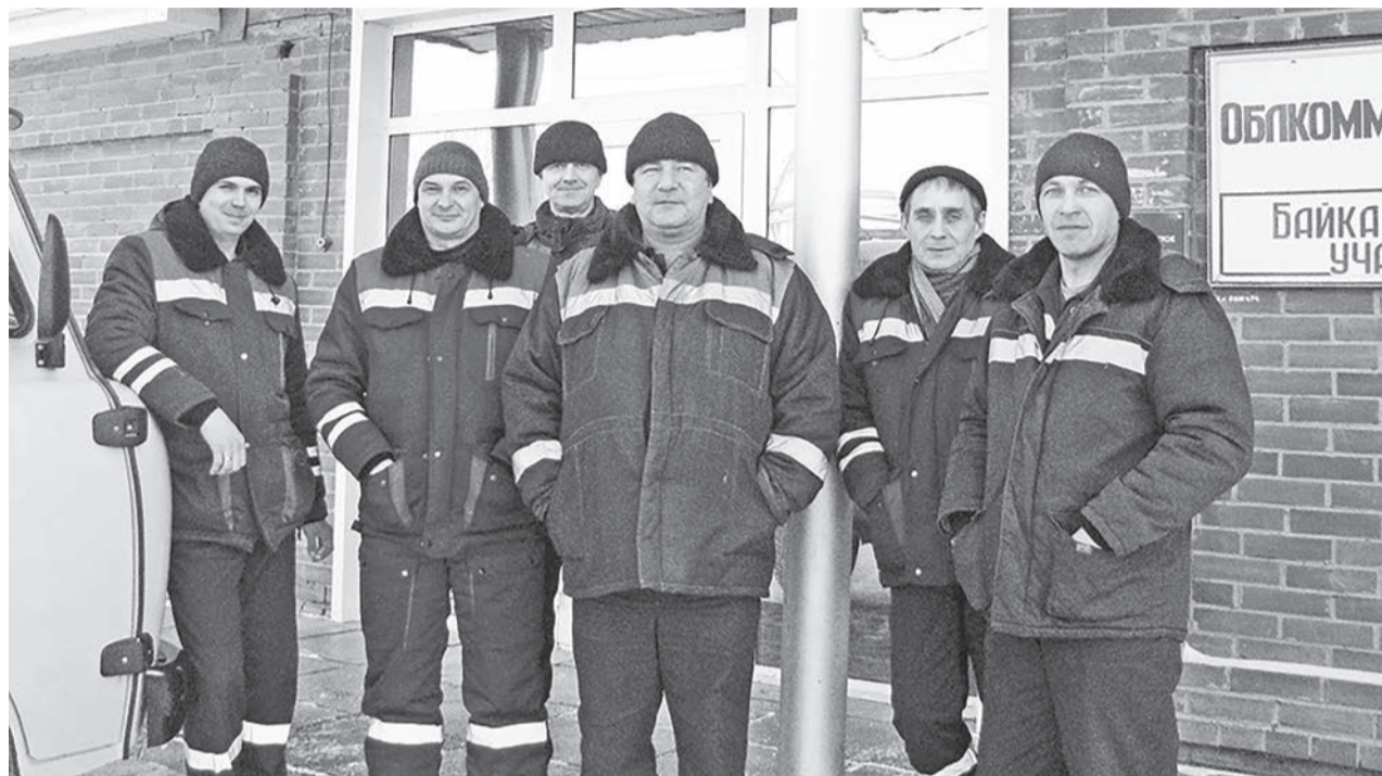
Оперативно-выездная бригада Байкаловского участка «Облкоммунэнерго».

Значит, у людей будет хорошее настроение при пользовании элект-