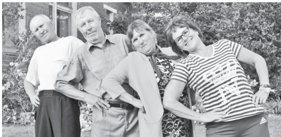
На туристический слёт собрались самые активные, весёлые, задорные, спортивные пенсионеры.

Поселенческий турслёт среди пенсионеров впервые проводился на нашей территории. И проходил он при поддержке администрации Баженовского сельского поселения. Специалисты нашей администрации в этом году приняли участие в конкурсе малых социальных инициатив,