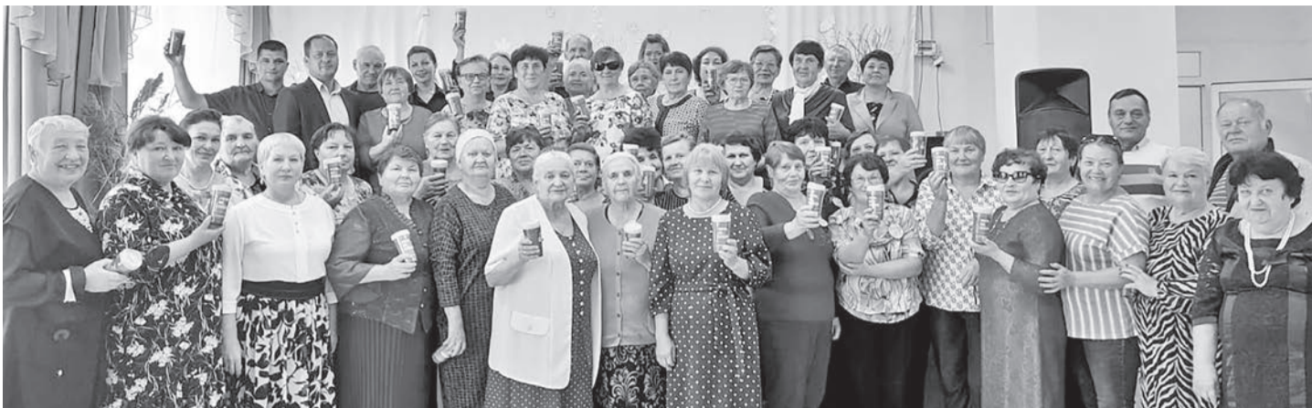
В честь открытия месячника пенсионера в Еланском ДК собрались советы ветеранов Краснополянского сельского поселения.