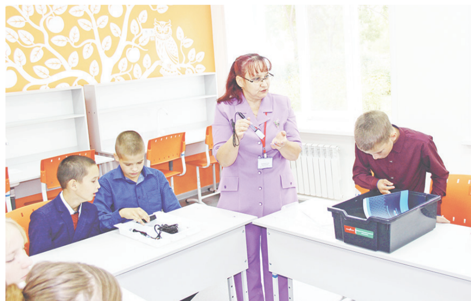
Педагоги показали и рассказали об оборудовании и о предстоящих уроках. Ребята с удовольствием и горящими глазами рассматривали новые приборы и датчики.

После церемонии для ребят и гостей были проведены экскурсии по лабораториям Центра.