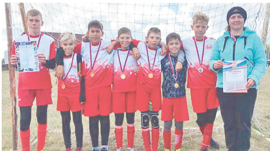
«Спутник» – первый в группе 2009-2010 годов рождения.

В результате группового этапа в финальную часть вышли четыре команды, занявшие первые и вторые места. В матче за третье место «Росичи» нанесли поражение дебютантам турнира – вязовцам – 4:1. В главном матче встретились «Журавли 12» и «Спарта». Игра получилась упорной и напряжённой. Силы команд были примерно равны. В первом тайме соперники обменялись голами. Во втором «Журавли»