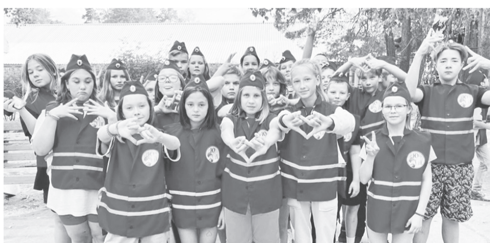
Юные инспекторы Байкаловского района в лагере «Дружба».

Детям нужно было разработать проект. Он состоял из трёх частей: