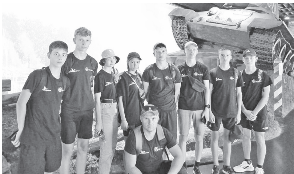
Поисковый отряд «Сварог» посетил «Музей Победы» в Москве.

За две экспедиционные недели поисковикам предстояло поднять останки красноармейцев, которые погибли при освобождении деревень Порядино, Шульгино и Максимовское