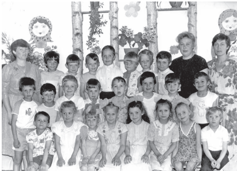
20 лет назад мы пришли в первый класс.