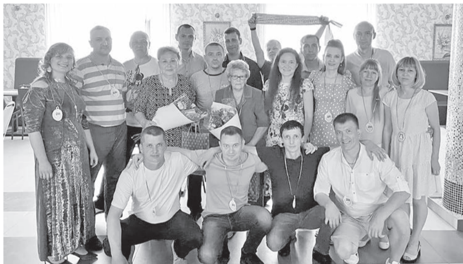
Встреча выпускников запомнится надолго.

очень яркой, запоминающейся. Огромная благодарность нашим любимым педагогам за то, что воспитали