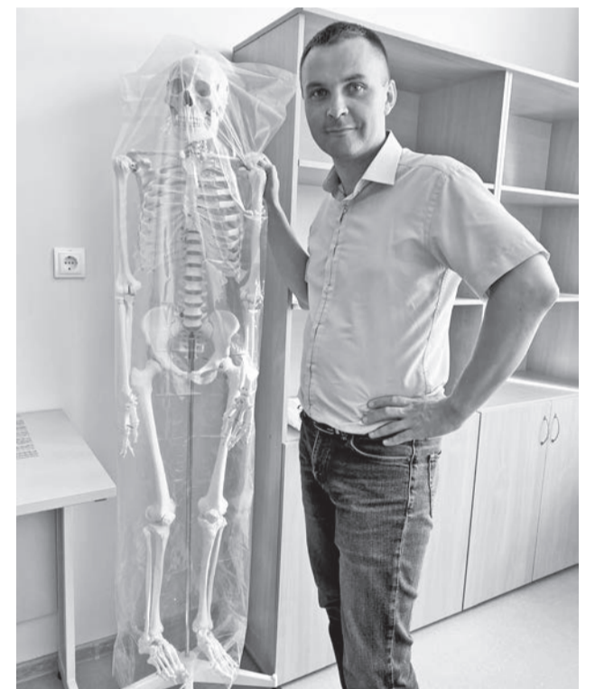
В учебных классах – всё необходимое для занятий.