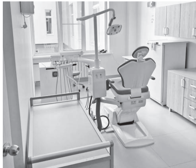
В новой школе будет работать свой стоматологический кабинет.

Министр разъяснил аграриям нынешнюю ситуацию с приобрете-