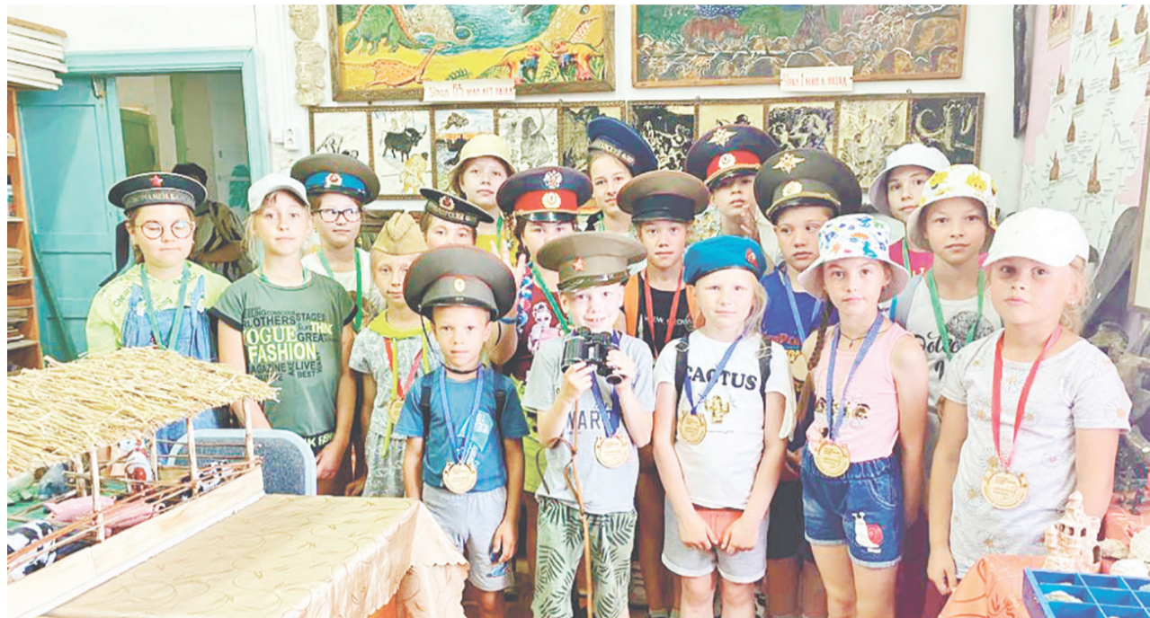
Дети увлечённо слушали и рассматривали экспонаты.