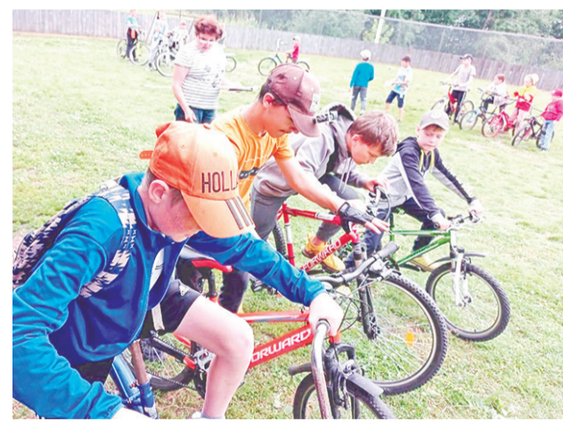
Для детей, посещавших летнюю площадку, было проведено множество игровых программ.

29 июля в Пелевинском ДК на концертной программе ребята раскрыли свои таланты. Такие концерты учат детей радоваться чужому успеху, учат их коммуникабельности и, конечно же, прививают и участникам, и зрителям эстетический вкус. И самое главное – ребята разных возрастов подружились, стали коллегами, партнёрами и продолжают своё творческое развитие в надёжной команде, способной на красивые дела, добрые поступки