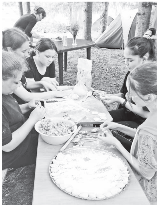
Самым творческим стал конкурс «Ужин».

танцевали, показывали сценки и рассказывали стихи.