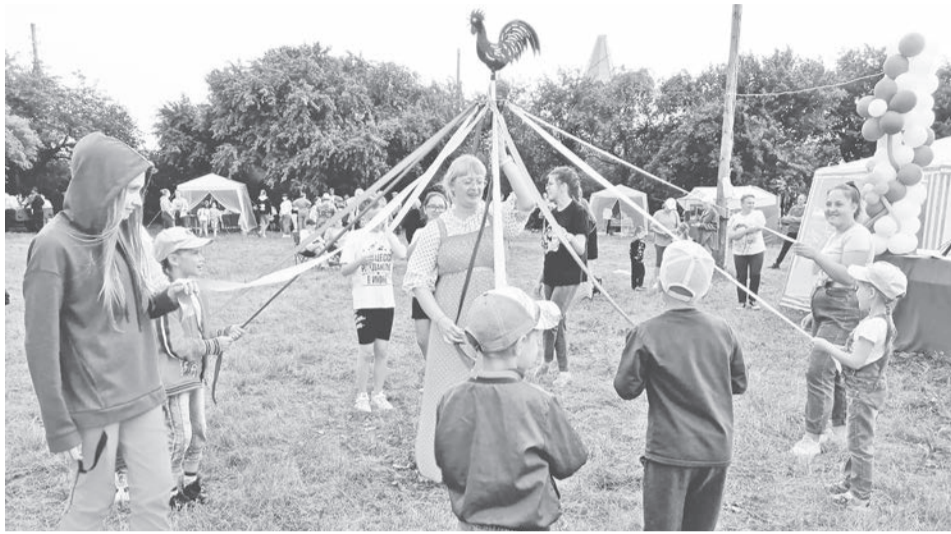
Работники Дубского Дома культуры организовали детские интересные народные игры и забавы.