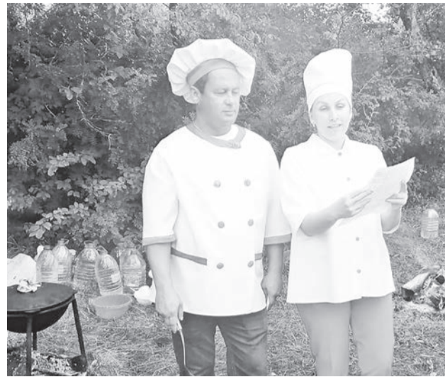
Семья Кошелевых победила в номинации «Уха с изюминкой».

Конкурс «Моя коса – моя краса» окунула нас в старину. Заявились три девочки. Первый этап – «Визитка», где участницы рассказали о себе и продемонстрировали свою косу. Второй – «К