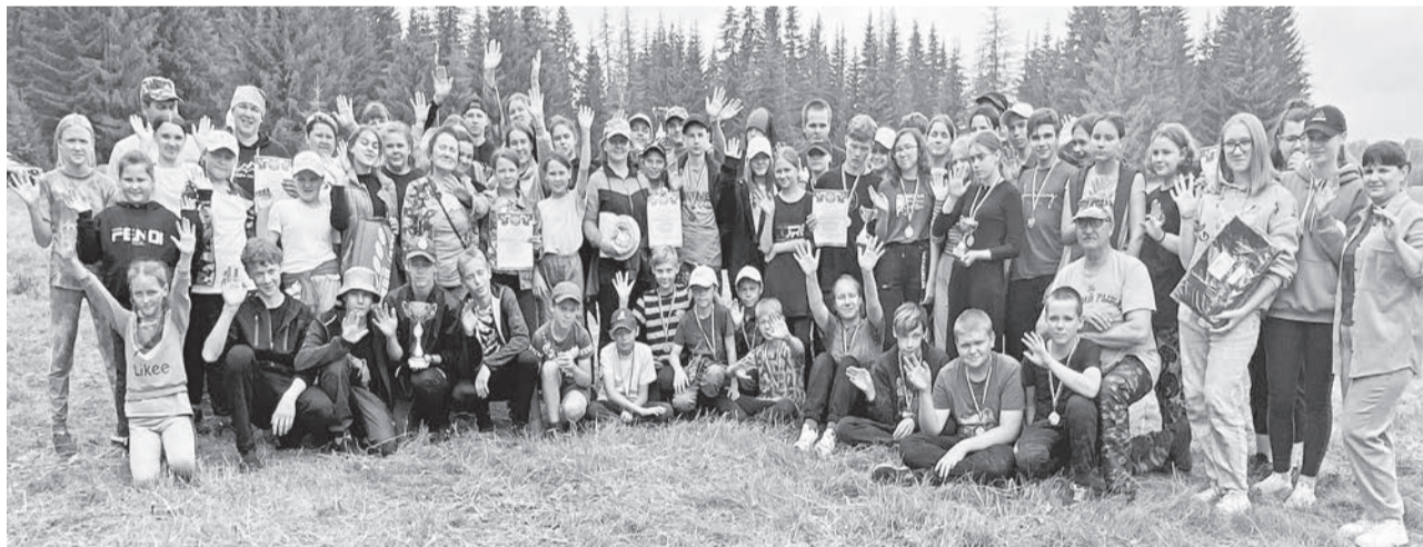
Турслёт – это всегда праздник.