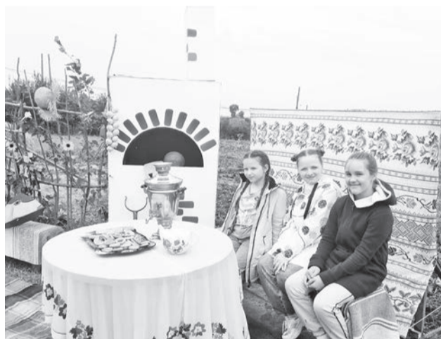
Фотозона привлекала внимание.

Яркая и весёлая вечерняя дискотека собрала всех жителей, земляков и гостей. Праздник завершился долгожданным салютом.