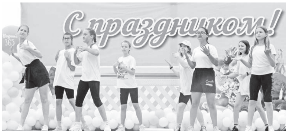
Праздник открыл детский танцевальный коллектив «Калейдоскоп».