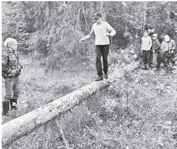
Переправа по бревну.

Первым этапом была визитная карточка. Каждая команда творчески представила себя. Пели песни, частушки,