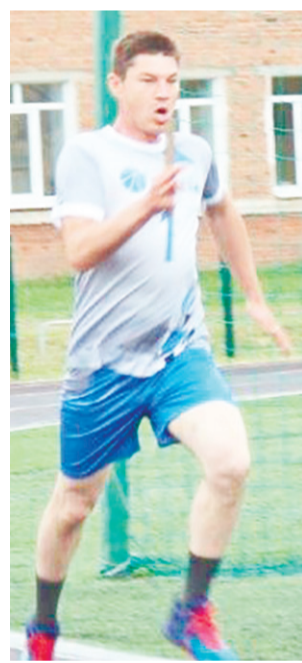
Легкоатлеты были вторыми в эстафете и третьими в прыжках в длину.