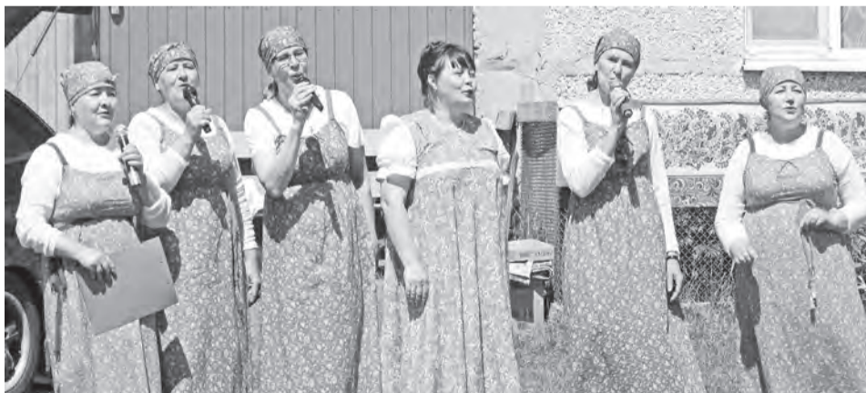
В течение всего дня гости наслаждались задушевными песнями.