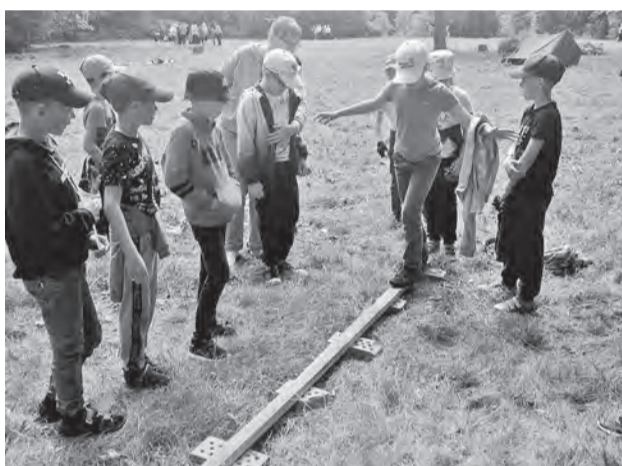
На данном этапе ребятам нужно было переправиться через «болото».

Детей ожидало десять остановок, задания на которых были непротыми. На этапе «Бревно» нужно было переправиться через «болото».