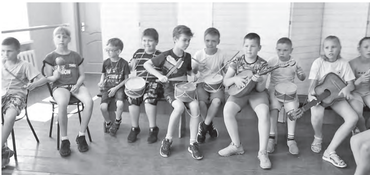
Весело пролетели дни на площадке.