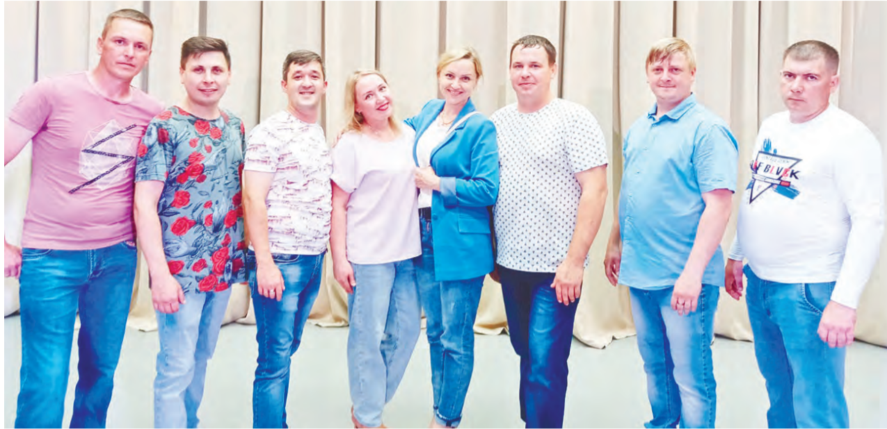
Песни Юрия Шатунова исполняли молодые артисты.