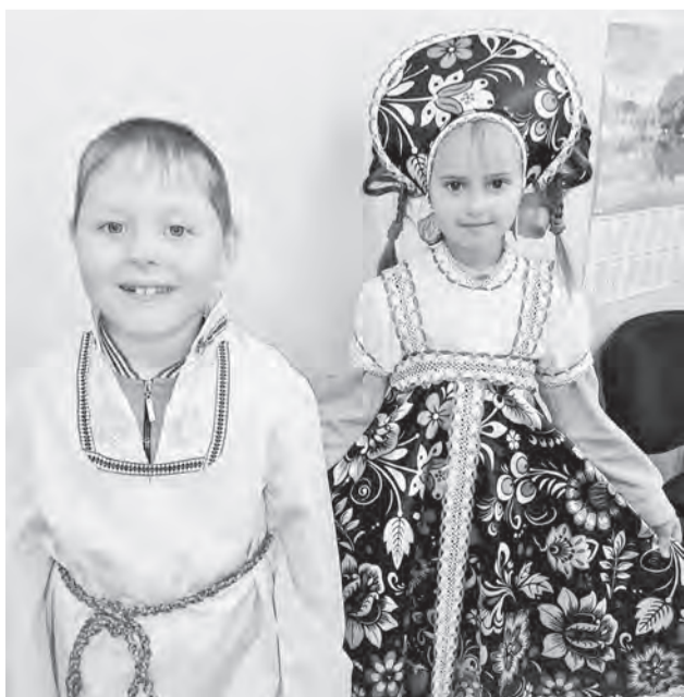
Ребята с удовольствием участвовали в мероприятиях.