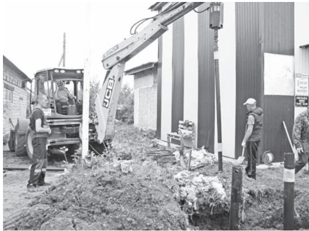
Началась реконструкция третьего участка теплотрассы.

Также переходящим объектом является строительство автодороги Шаламы – Соколова – Сапегина протяжённостью 6,9 километра. В этом году дорожным строителям АО «Мелиострой»