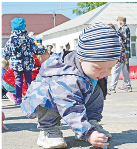
Все желающие оставили рисунки на асфальте.