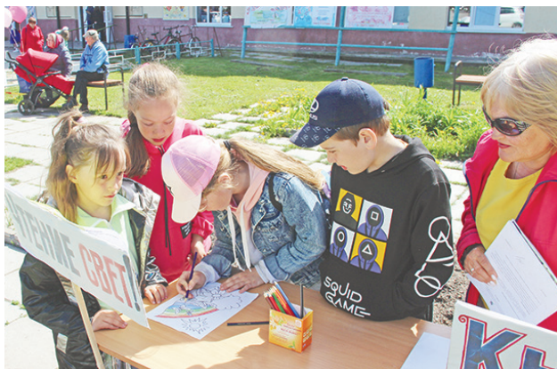
Центральная библиотека провела квест.