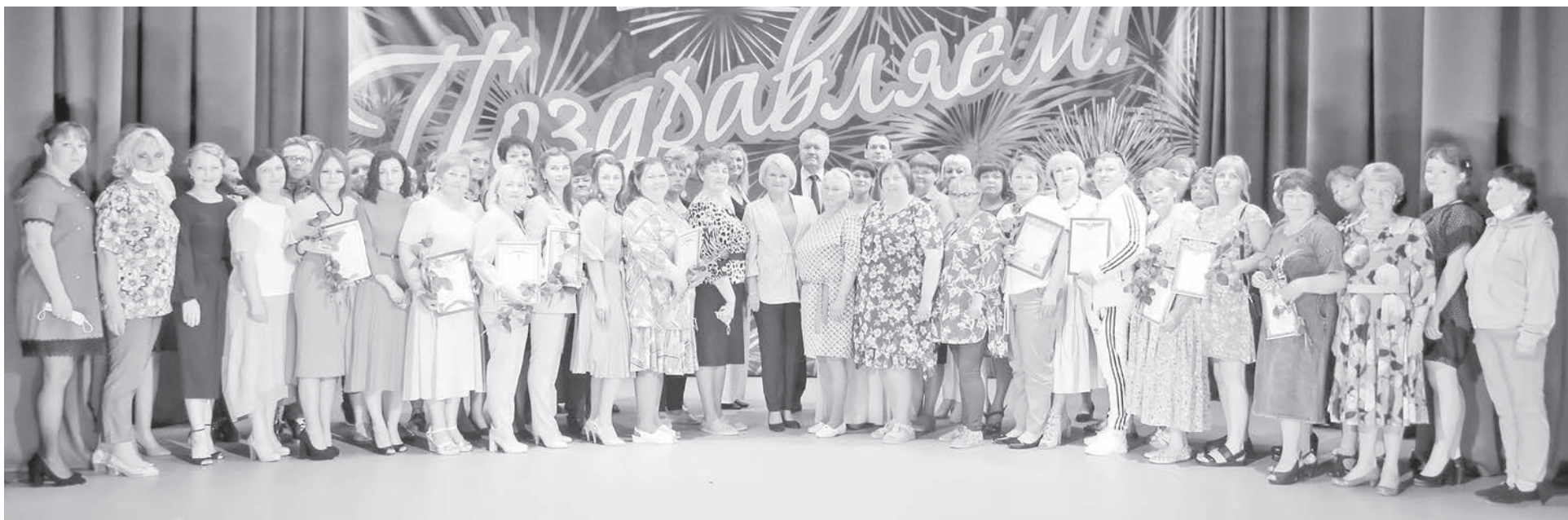
Коллектив Комплексного центра социального обслуживания населения отмечает 25-летие.