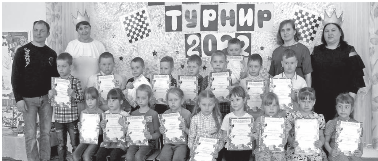
Участники районного шашечного турнира.