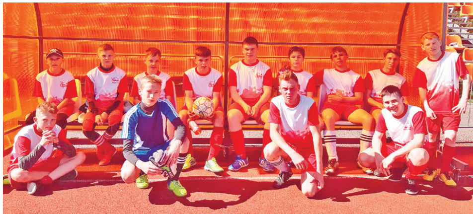
Сборная Байкаловского района попробовала свои силы на окружающих соревнованиях.

Соревнования проходили на ирбитском стадионе, оборудованном согласно всем требованиям. За выход в областной финал боролись девять коллективов. Только два из них были сельские – наш и Ирбит-