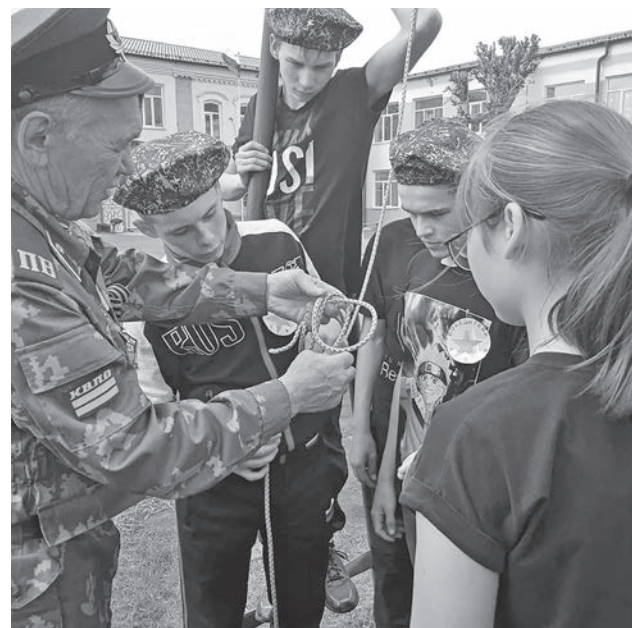
На одном из этапов.

И вот соперники прибыли, команды построены и... началось, закрутилось. Парад зарничников,