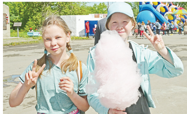
Сладкая вата – любимое лакомство детей.

каждой образовательной организации, в каждом детском объединении была своя праздничная программа.