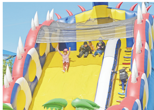
Работали аттракционы: батут, карусель, дартс...