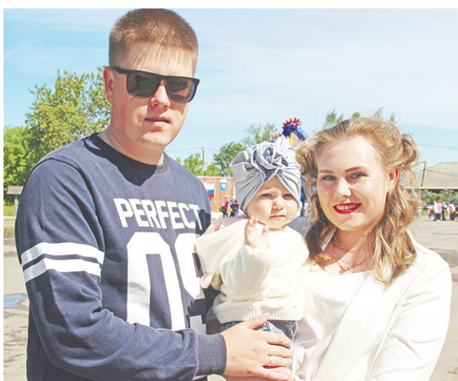
Счастливы дети – счастливы родители.