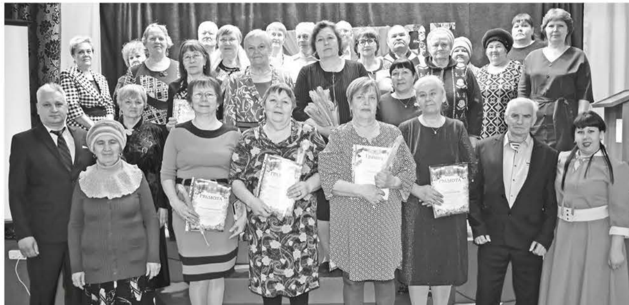
Юбилей ветеранской организации – хороший повод собраться вместе.

мероприятия, все заслуги ветеранской организации, а их за 35 лет накопилось немало.