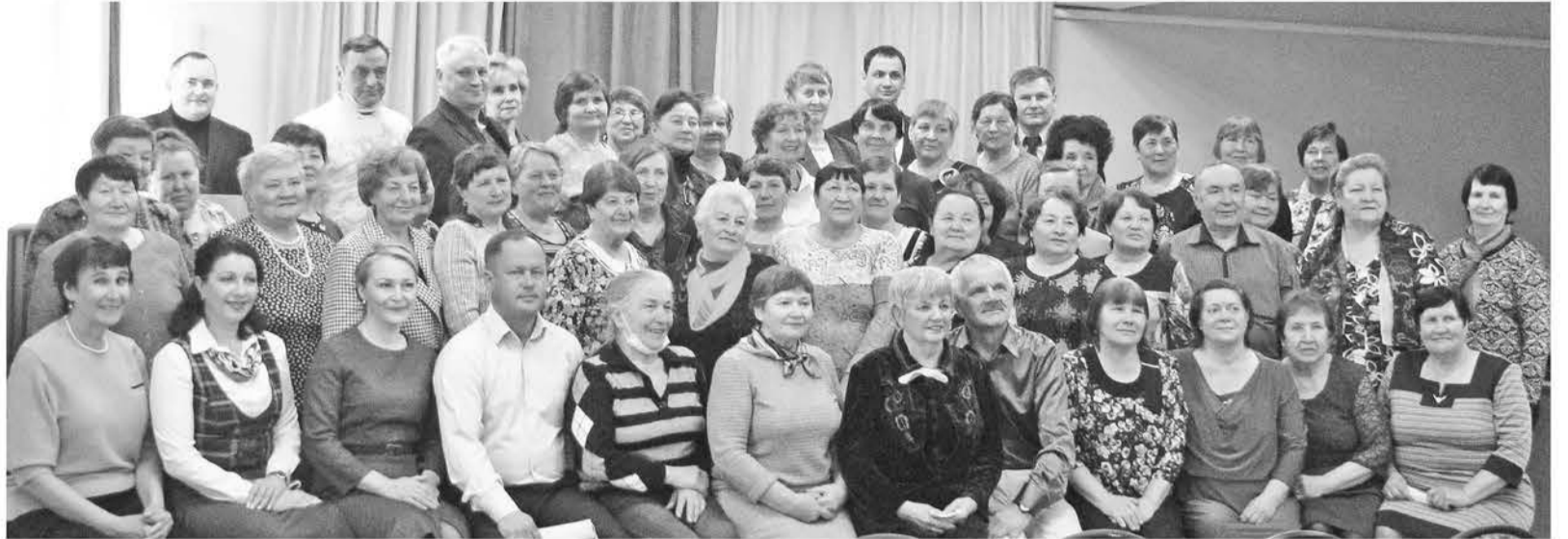
Фото на память.

В начале апреля в помещении Байкаловского детско-юношеского центра «Созвездие» состоялась встреча председателей первичных ветеранских организаций и активистов с главами района и сельских поселений, а также с руководством ЦРБ, представителями управления социальной политики и Комплексного центра социального обслуживания населения.