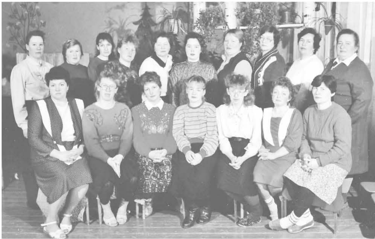
Работать в детском саду – это призвание, великий труд.