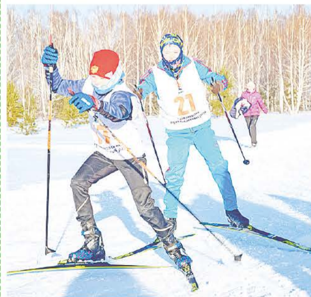
Борьба за призовые места.