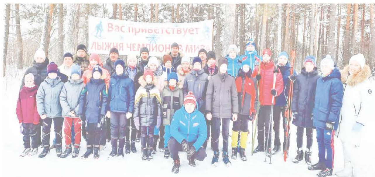
Делегация Байкаловской детско-юношеской спортивной школы.