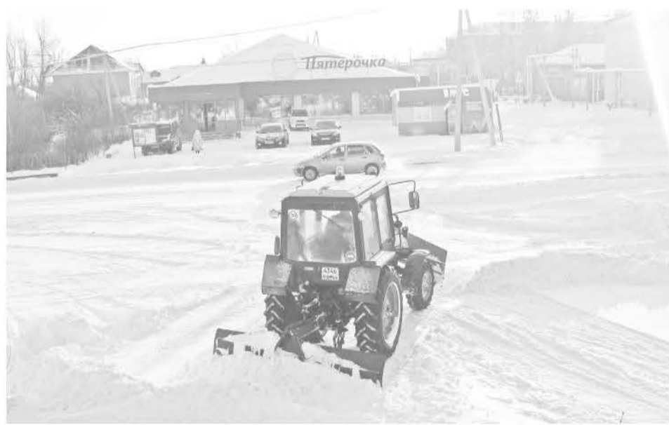
Улицу Мальгина в Байкалово обслуживает МУП ЖКХ «Тепловые сети».

На территории Байкаловского СП 120 километров автодорог, которые необходимо содержать в нормативном состоянии в течение всего календарного года. В зимний