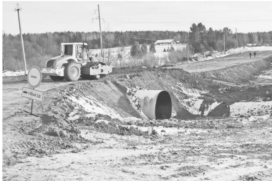
На первом этапе проложили водопропускные трубы, оканавили земляное полотно будущей трассы, создали запас строительных материалов.

В 2019 году администрация сельского поселения объявила торги на разработку проектно-сметной документации «Реконструкция автодороги общего пользования местного значения д. Шаламы – д. Соколова – д. Сапегина». После разработки и утверждения проекта начались строительные работы. Как рассказали в администрации поселения, строительство будет вестись в три этапа. Окончание намечено на 2024 год. Общая протяжённость реконструируемых участков