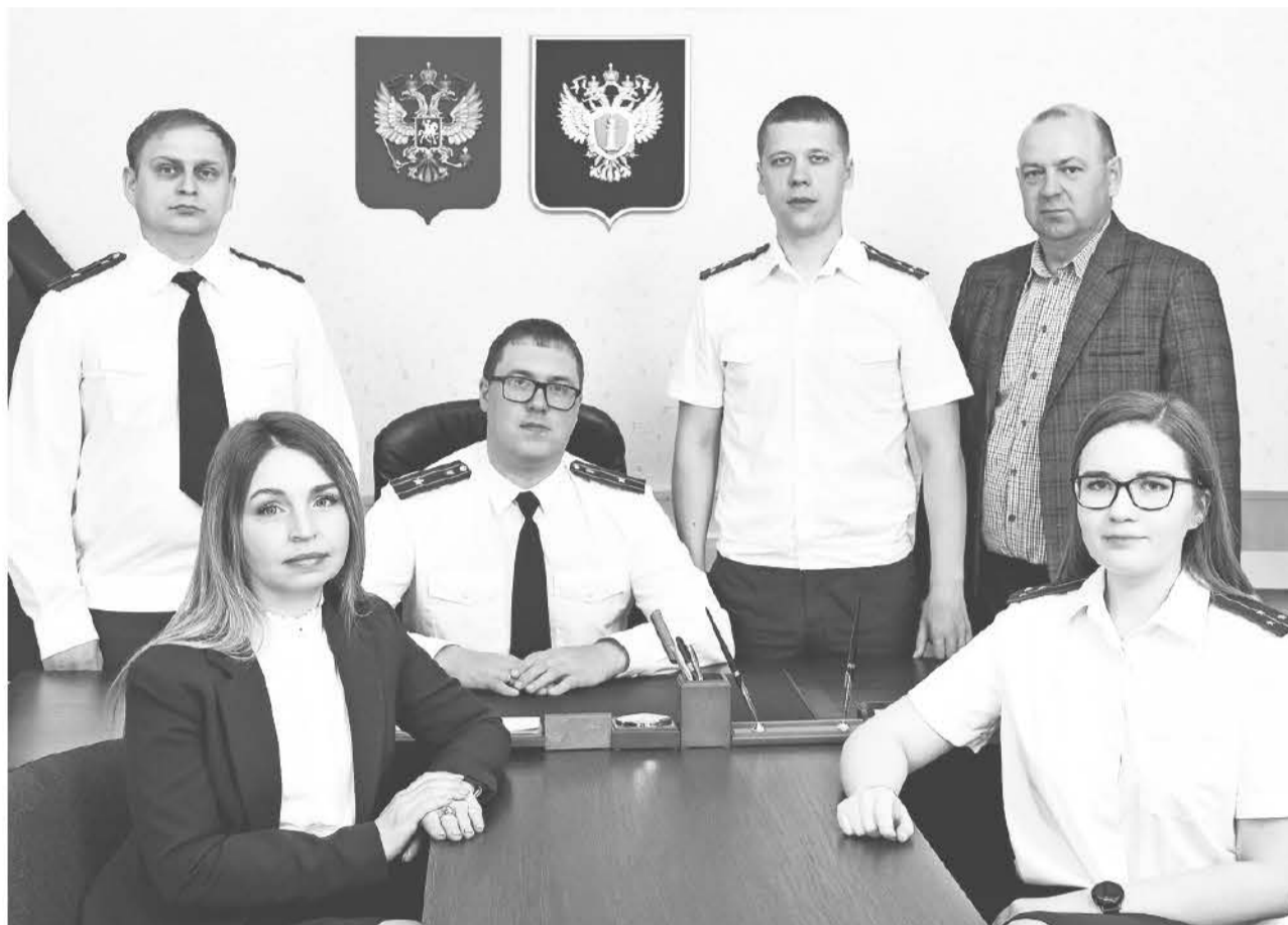
Коллектив прокуратуры Байкаловского района.