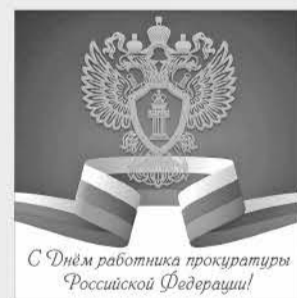
С Днём работника прокуратуры Российской Федерации!

День работника прокуратуры Российской Федерации – это праздник людей долга и чести, стоящих на страже интересов государства, защищающих общество и конкретного человека. Охранять законность и правопорядок – одна из самых почётных и ответственных