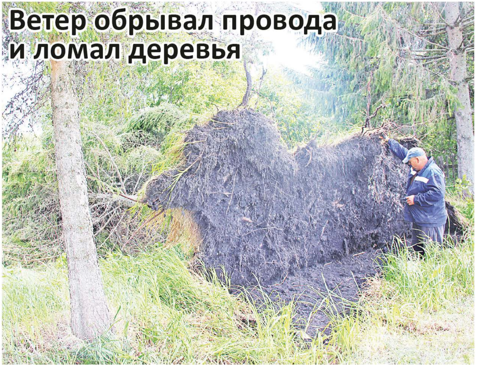
Сильный ветер не только обрывал линии электропередач, но и валил деревья. Так, в Нижней Иленке ветер повалил две большие ели.

Штормовой ветер добавил головной боли и байкаловским энергетикам. Сигналы об отсутствии электроснабжения в Байкаловский РЭС начали поступать уже вечером. Проблемы были в Байкалово, Шаламах, Комлевой, Шадринке, Верхней Иленке, других населённых пунктах. Устранение последствий непогоды началось незамедлительно. Были задействованы две аварийные бригады – шесть человек и две единицы техники. Восстановительные работы продолжались и в ночное время. К утру понедельника электроснабжение всех потребителей было восстановлено.