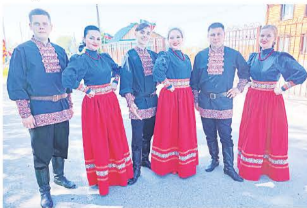
Нынешний состав коллектива «Традиция».

С самого начала была идея создать молодой коллектив, исполняющий народную стилизацию.