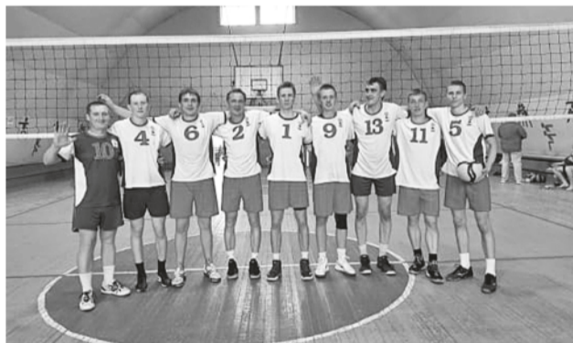
Мужская сборная района.