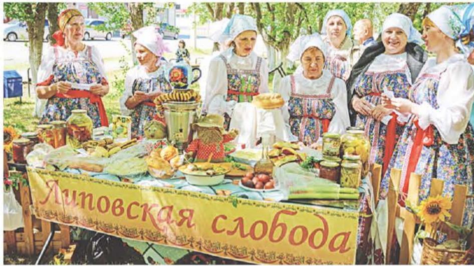
Каждая территория оформляла свой стол, свою зону выступления.

В номинации «За лучшее блюдо» победила команда народного коллектива «Хор ветеранов» при ЦДК.