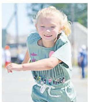
Любители бега вышли на старт легкоатлетического кросса «Кольцо Городища».

В июне в Городище ярко и широко прошёл традиционный день отдыха и спорта, приуроченный ко дню рождения села.