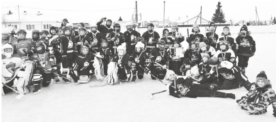
В гости к «Стальным журавлям» приезжали ребята из Тюмени, Ирбита и Пышмы.

Настоящий праздник с большим количеством болельщиков и участников получился на стадионе «Лидер». В гости к «Стальным журавлям» приехали ребята из Тюмени, Ирбита и Пышмы. В первой игре ирбитчане натужно, в одну шайбу, одолели пышминцев. Наши парни в упорном поединке уступили Тюмени 2:3. В матче за