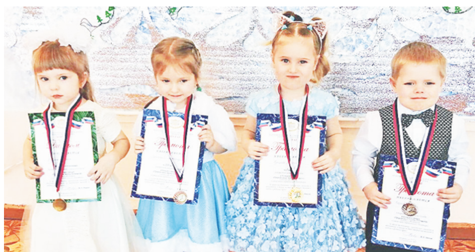
Самые маленькие победители (3-4 года).

Значение знакомства дошкольников с произведениями классиков-поэтов недооценивать нельзя. Изучение литературно-культурного наследия русских классиков помогает заложить в детях чувство гордости за свой народ, за своё Отечество, воспитывает любовь к Родине, делает детей умнее и добрее, сознательнее и отважнее. С этой целью и задачами по совершенствованию художественно-речевых и исполнительских навыков дошкольников в начале февраля в Байкаловском детском саду «Богатырь» прошёл конкурс чтецов «Природе края строки посвящаем». В нём получили возмож-