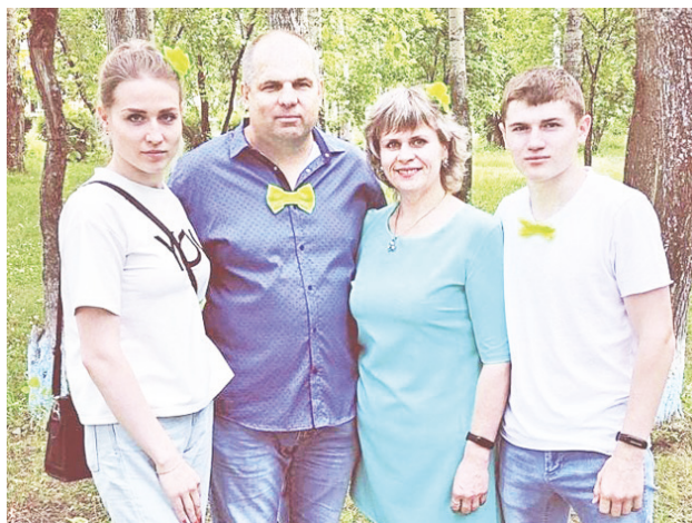
Главное – это семья.

– Сначала мы были как филиал байкаловского клуба «Спутник», так и