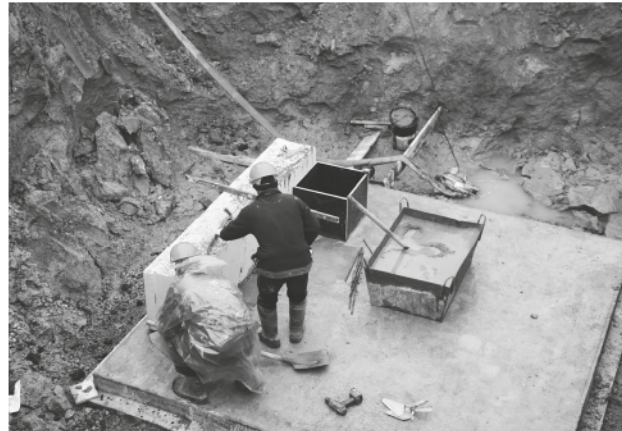
Идёт строительство теплового узла.

На стройке появился собственный бетоносмесительный узел, что обеспечивает бесперебойную поставку бетона. Если два месяца назад работы велись в огромном котло-