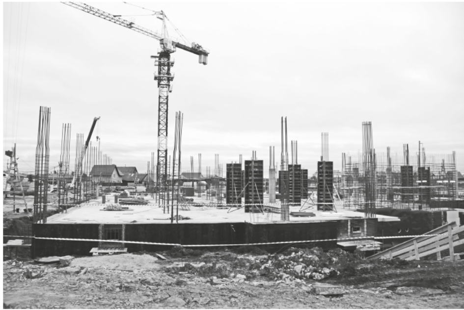
Школа стремится в высоту.