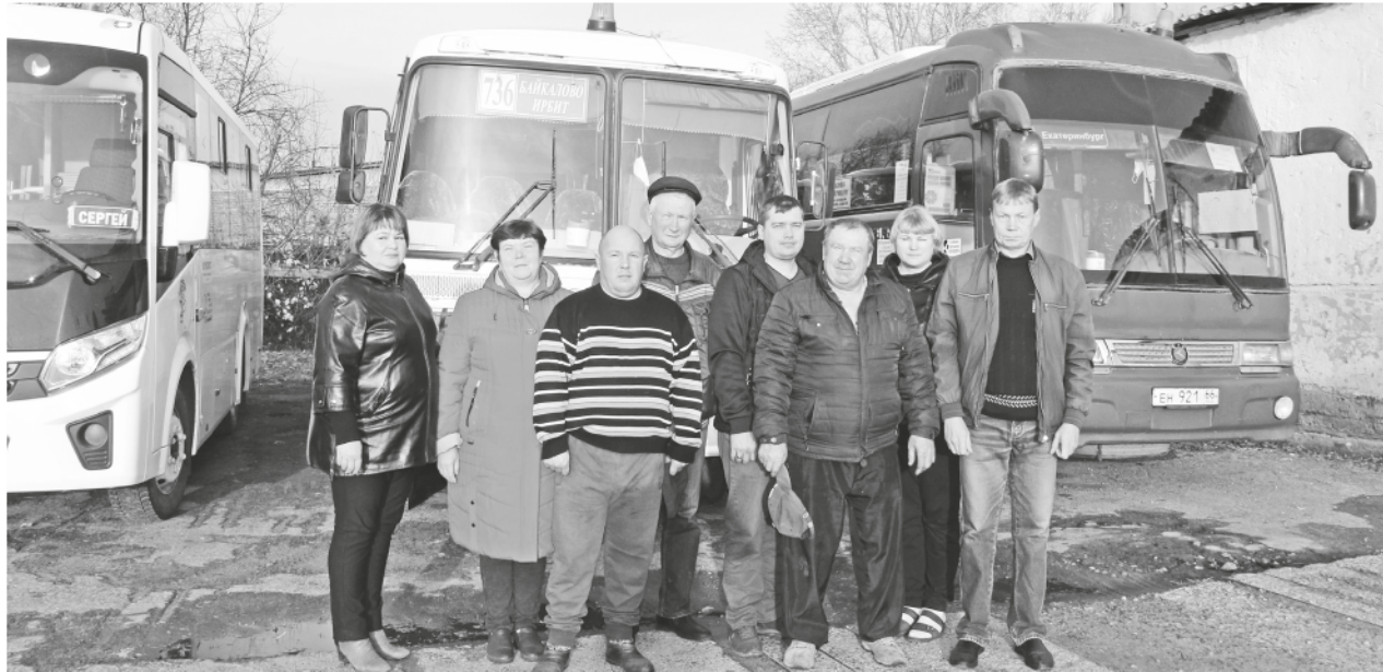
Коллектив ООО «Экспресс».

Уважаемые друзья, коллеги, весь коллектив ООО «Экспресс» и ИП, в преддверии Дня автомобилиста хочу сказать вам огромное спасибо за работу. Нынешний год оказался безумно сложным по известным причинам, но мы выдержали, выстояли, потому что были единой командой. Мне трудно выделить кого-то отдельно, да и это ни к чему. Вы все на своих местах, все работаете на