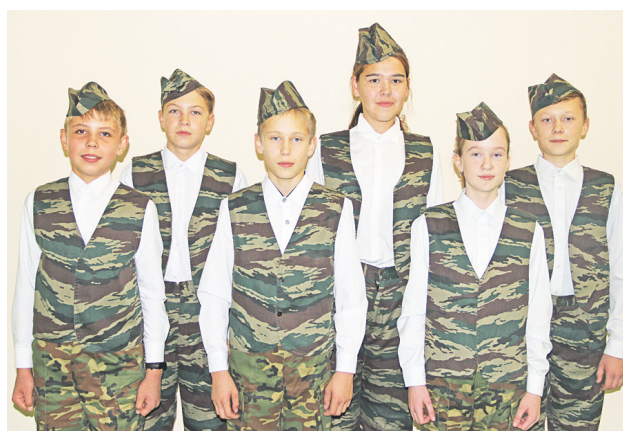
Учащиеся Нижнеиленской школы стали лучшими во второй возрастной группе.

В конце сентября коллектив Центра внешкольной работы организовал традиционную районную военно-туристскую игру «Зарница». В этом году она проводилась в дистанционной форме. Несомненно, «Зарница-2020» запомнится участникам, руководителям команд, членам жюри и организаторам тем, что впервые за мно-