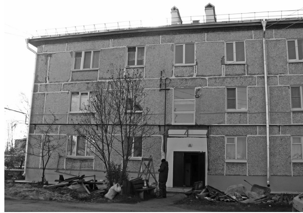
Фасад дома заметно изменился.