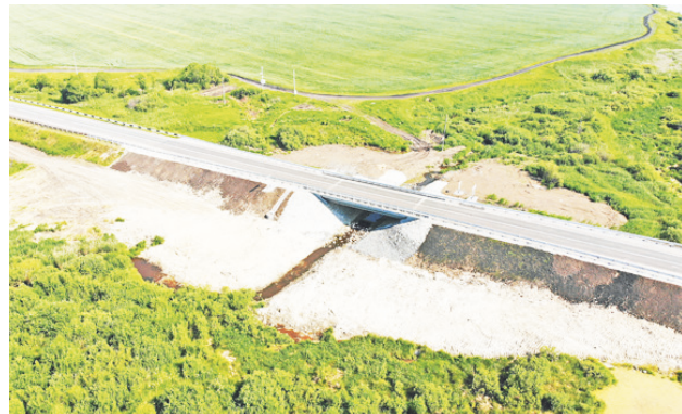
Реконструкция мостового перехода через р. Липовку на автомобильной дороге с. Байкалово – с. Туринская Слобода – г. Туринск на территории Туринского ГО.

– К сожалению, не так много, как нам бы хотелось. На собеседование ко мне пришли пять человек, по всем ребятам я приняла положительное решение, однако в конечном итоге в этом году мы заключили договор на обучение только одного человека, остальные отказались без объяснения причин или вообще не пришли больше (что было довольно некрасиво с их стороны, на мой взгляд). Ну да ладно, я уверена, что все «наши» люди к нам пришли или придут, а остальных нам не нужно. Опять же, небольшое количество заявок – это хороший показатель, так как он означает, что все местные ребята поступили туда, куда хотели на бюд-