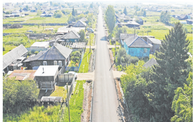
Капитальный ремонт дороги в с. Елань по ул. Свободы.

Помимо этих объектов, в этом году у нас было