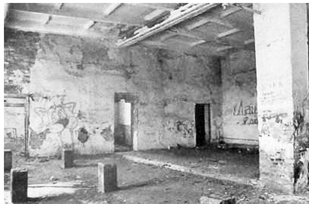
Внутри полная разруха.