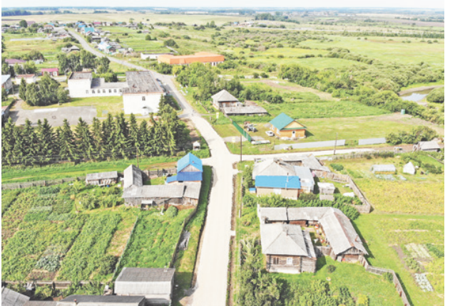
Ремонт дорог в Баженовском сельском поселении.

– Весной Вы возобновили программу обучения за счёт компании выпускников 9-11 классов в профильных учебных заведениях среднего образования. Сколько