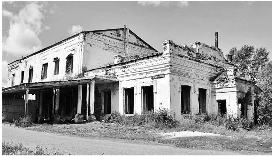
Здание Скорбященской церкви сейчас заброшено и разрушается.

Остатки ещё одной церкви, которую можно найти на просторах Байкаловского района, находятся в деревне Макушиной. Из всех обителей нашей территории она одна из самых «молодых», построена в начале XX века. После закрытия для службы здание практически не пустовало, а почти сразу начало приносить пользу молодому советскому государству. Зато сейчас заброшено, разрушается и не восстанавливается.