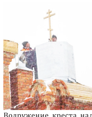
Водружение креста над алтарём.