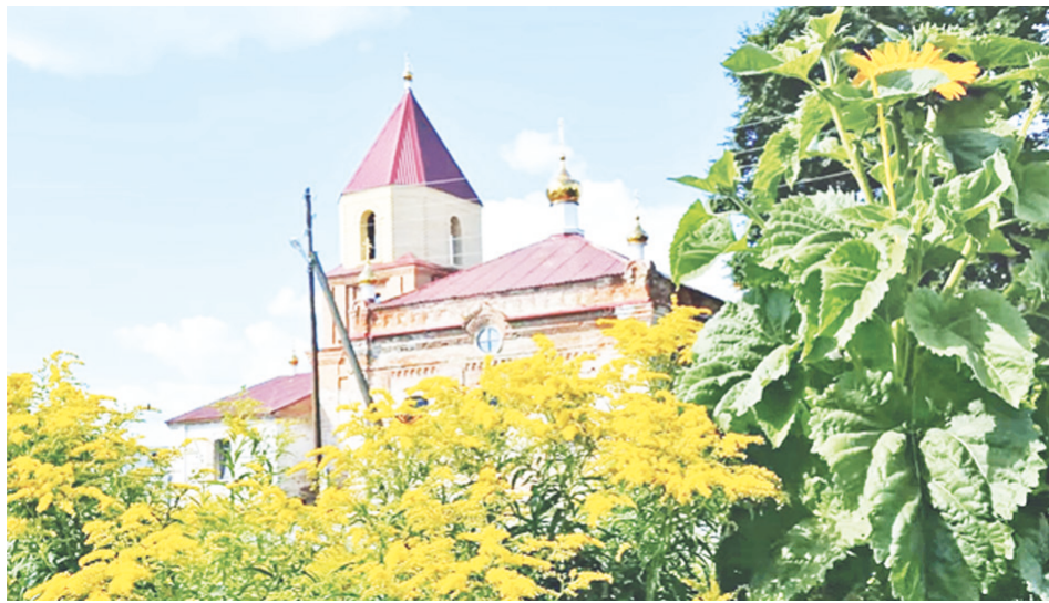
Храм в Городище.