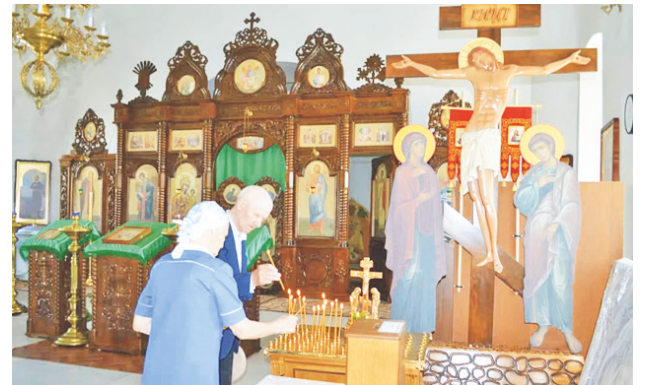
Иконостас Городищенского храма.

17 июля прошёл большой крестный ход и при въезде в село установили 5-метровый Поклонный крест, изготовленный