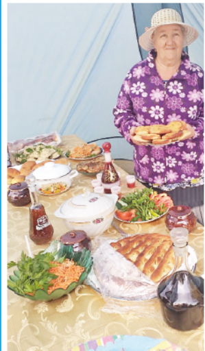
Традиционные блюда народов Среднего Урала.