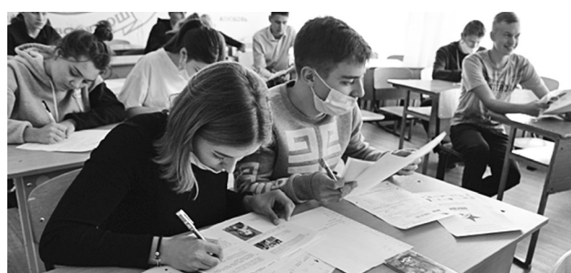
Байкаловская СОШ стала площадкой для написания Диктанта Победы.

2020 год – год 75-летия Победы в Великой Отечественной войне. Всероссийская политическая партия «Единая Россия» совместно с Российским историческим обществом, Российским военно-историческим обществом, ВОД «Волонтёры Победы», Российским союзом ветеранов и другими организациями в рамках федерального проекта партии «Историческая память» реализует ряд проектов патриотической направленности, в том числе Всероссийскую просветительско-патриотическую акцию «Диктант Победы», впервые проведённую в 2019 году. Наш долг, долг потомков поколения победителей, – помнить о подвиге многонационального советского народа, беречь правду о войне и героях Великой