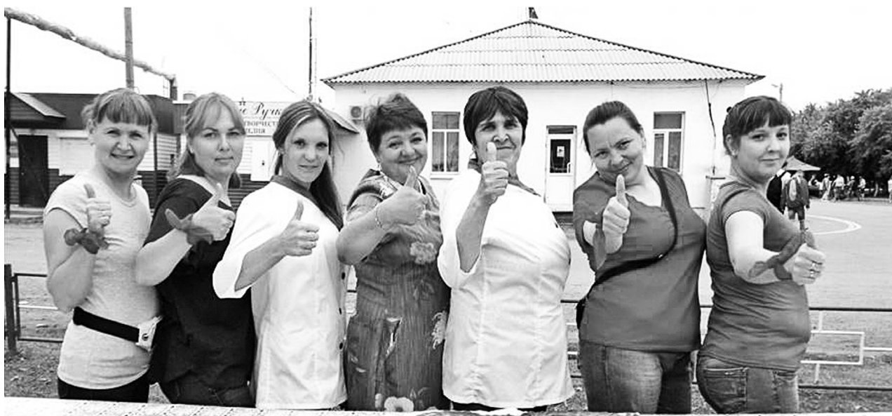
Дружный коллектив детского сада «Богатырь».