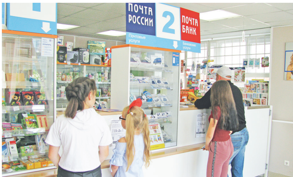
В Байкаловском отделении почтовой связи всегда многолюдно.

многодетная мать 4-х детей. Самому старшему – 10, младшему – 3 годика. Хорошо, что есть бабушка Нина, она и водится с малышами по причине занятости мамы. Муж работает в дорожно-строительной организации – АО «Мелиострой». Свободного времени тоже мало, но старается на досуге всё делать для семьи, для дома. А «смежные» специальности хозяйки пришлись как нельзя кстати для большой семьи.