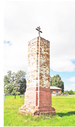
Столб, оставшийся на месте разрушенного храма.

В начале XX века была построена большая каменная школа. В 1904 году в ней начались занятия. Моя прапрабабушка родилась в 1894 году и хорошо запомнила открытие школы. «Это был самый большой и красивый дом в селе. Окна в нём выше нашего роста, в классах высокие двери и потолки. Все ребята восхищались новой школой», – рассказывала она.