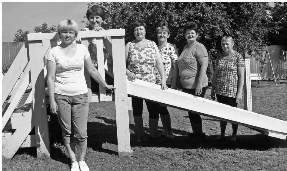
Коллектив Вязовского детского сада готов к приёму детей.

В соответствии с распоряжением администрации Байкаловского района №143-р от 2.07.2020 года с 15 июля все муниципальные детские сады начинают работу в штатном режиме с 50-процентной наполняемостью и соблюдением противоэпидемиологических мер. Мы отправились в Вязовку и посетили, как местное дошкольное учреждение готовится к открытию после перерыва.