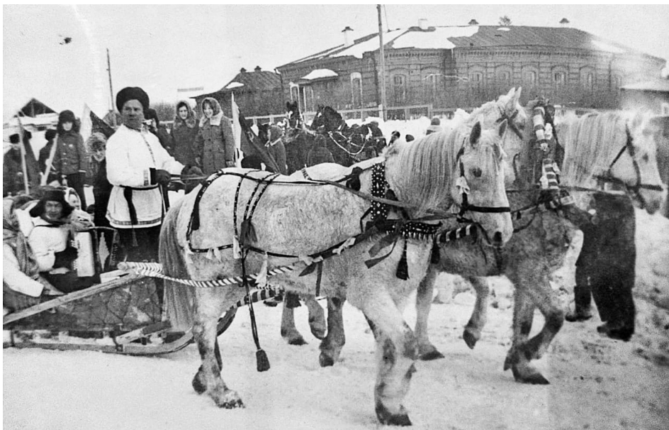
Площадь около школы всегда была местом народных гуляний.