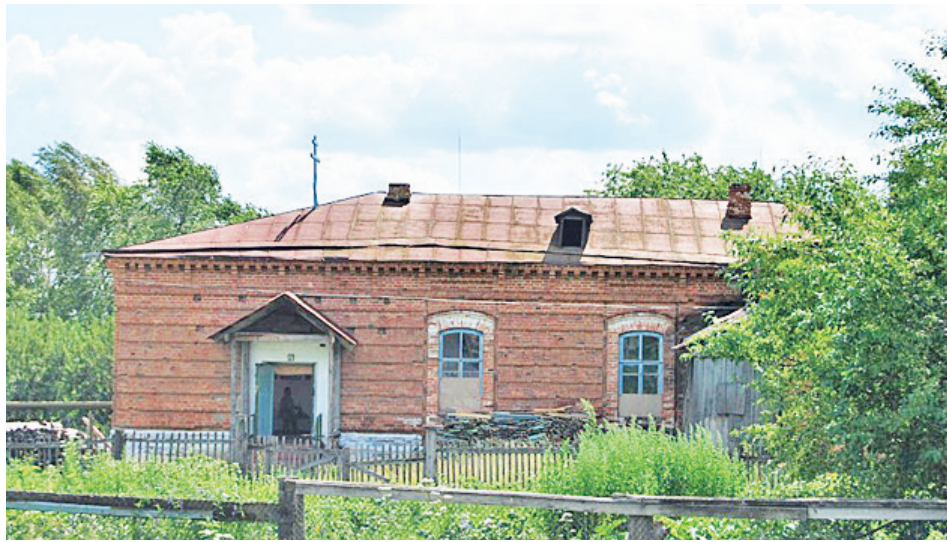
Здание старой школы сохранилось, но заброшено.

Из сборника «Приходы и церкви Екатеринбургской Епархии», изданного в Екатеринбурге в 1902 году, мы узнаём следующее: «Село Чурманское находится в 220 вёрстах от Екатеринбурга при небольшой речке Чурманке. Жителей на приходе на 1900 год было 1043 человека мужского пола и 1112 человек женского пола, все они государственные крестьяне, занимающиеся хлебопашеством и принадлежащие к великорусскому племени, все православного вероисповедания. К приходу относятся 6 деревень: Потопова (или Шеболтасова), Тоскуева, Боталова, Моисеева, Дягилева и Межевая (или Захлыстина). Чурманский приход был открыт в 1770 году. Первая церковь – деревянная однопрестольная – была пере-