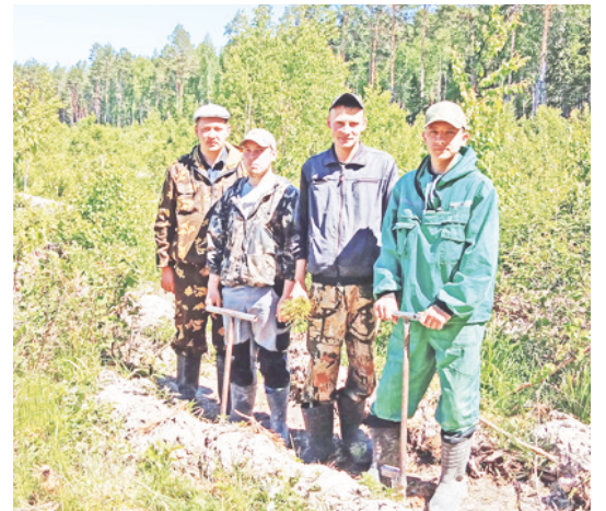
Специалисты Уральской авиабазы ведут лесовосстановление на территории Еланского участкового лесничества.