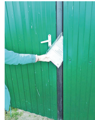
Голосование проходило со всеми мерами предосторожности.