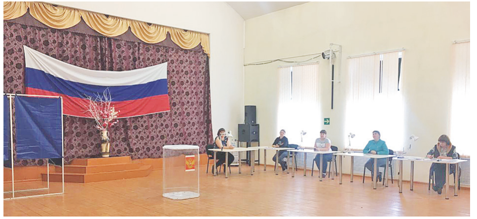
Избирательные участки готовы к голосованию.