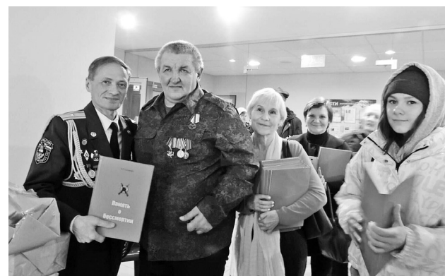
На Дне Памяти по уральским дивизиям. 14 марта 2020 года.