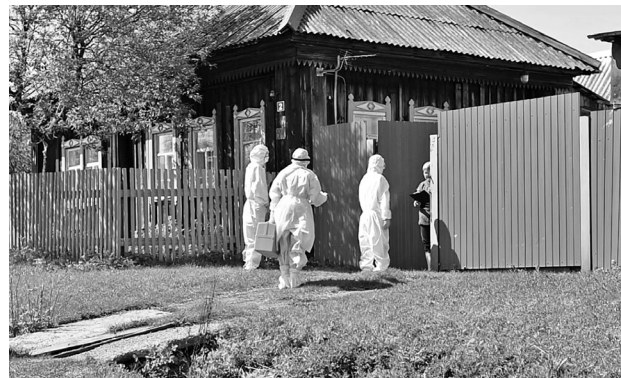
Работники Байкаловской ЦРБ вручают постановление о госпитализации.

За прошедшие семь дней коронавирус подтверждён ещё у одного человека (о первых двух случаях мы писали в предыдущем номере). Это также жительница Ляпуново. Работники Байкаловской районной центральной больницы при содействии Роспотребнадзора и сотрудников полиции в конце прошлой недели вручили ей постановление о госпитализации. Под наблюдением врачей на самоизоляции находятся 11 человек. Трое из них – это курсанты военных высших учебных заведений, прибывшие домой. Восемь – контактные лица Ляпуновской территории.