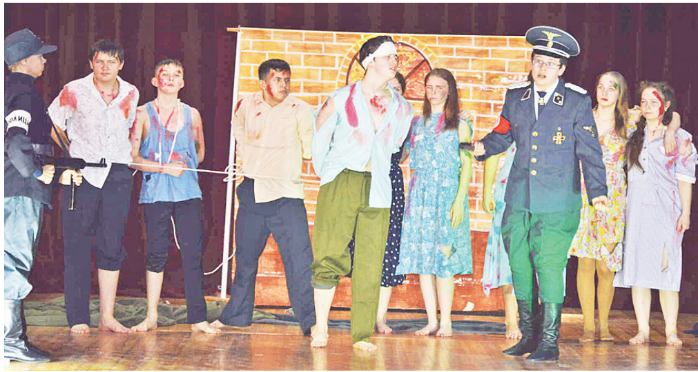
Ученики Городищенской СОШ с драматическим спектаклем «Молодая гвардия».

Всем нам известна ситуация в стране и мире. Карантин – помеха многим мероприятиям. Но, несмотря на это, районный этап «Театрального сезона» – состоялся! Ежегодно дети всех школ Байкаловского района соревнуются в своих актёрских способностях. Юные артисты демонстрируют различные постановки литературных произведений с декорациями, костюмами и музыкальным сопровождением. В общем, всё как в настоящем театре.