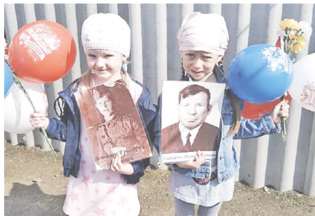
Каждый год в День Победы со своими родными мы принимаем участие в акции «Бессмертный полк».

Наша память о Великой Отечественной войне с годами становится всё более значимой: всё глубже видны подвиг советских людей в борьбе с силами фашизма и труднейшие испытания, которые исковеркали людские судьбы. В год празднования 75-летия Великой Победы мне хочется рассказать о своих родных, которые воевали на той страшной войне и работали в тылу.