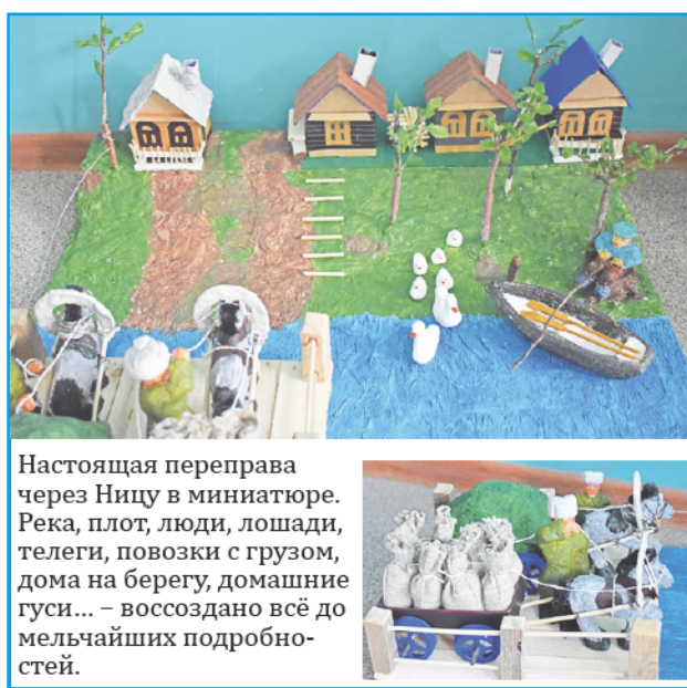
Настоящая переправа через Ницу в миниатюре. Река, плот, люди, лошади, телеги, повозки с грузом, дома на берегу, домашние гуси... – воссоздано всё до мельчайших подробностей.