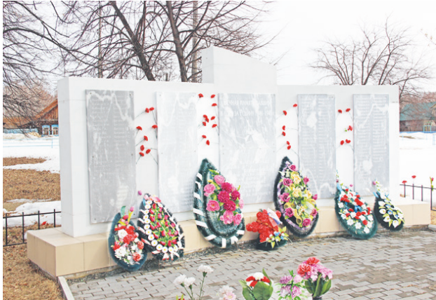
Обелиск в Чурмане.

Памятник в Любиной небольшой. Основание с тремя установленными мраморными плитами, на которых высечено 116 фамилий, небольшая оградка, венки, рядом две деревянные скамейки. Скромно, но симпатично и ухоженно.