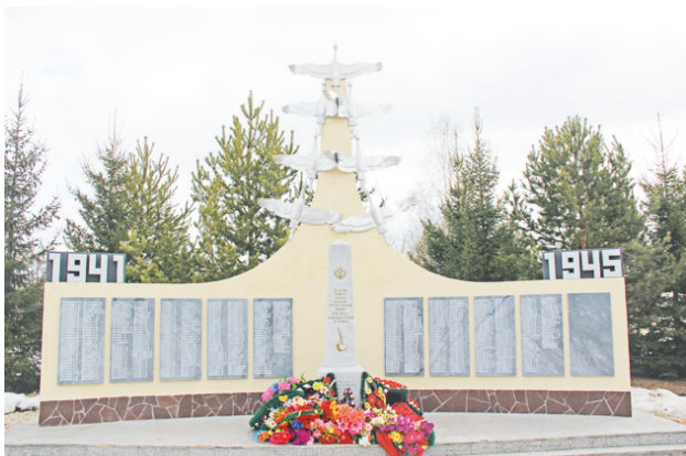
Мемориал в Краснополянском – самый новый в поселении.

Переезжаем дорогу, ведущую в Ирбит. Через шесть километров мы в Чурманском. Памятник установлен в сквере в центре села, среди яблонь. В мае, когда всё в цвету, здесь, должно быть, особенно красиво. Обелиск отдалённо похож на любинский, но намного больше. Всё красиво, уютно, ухоженно. В камне увековечены 130 земляков.