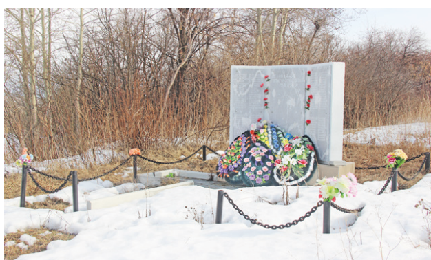
Памятник в Любиной небольшой.