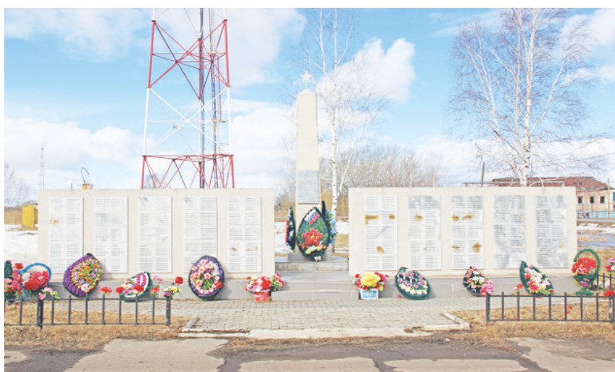
На плитах еланского памятника видны коричневые пятна, а фамилии невозможно прочесть. Местами отпала плитка.