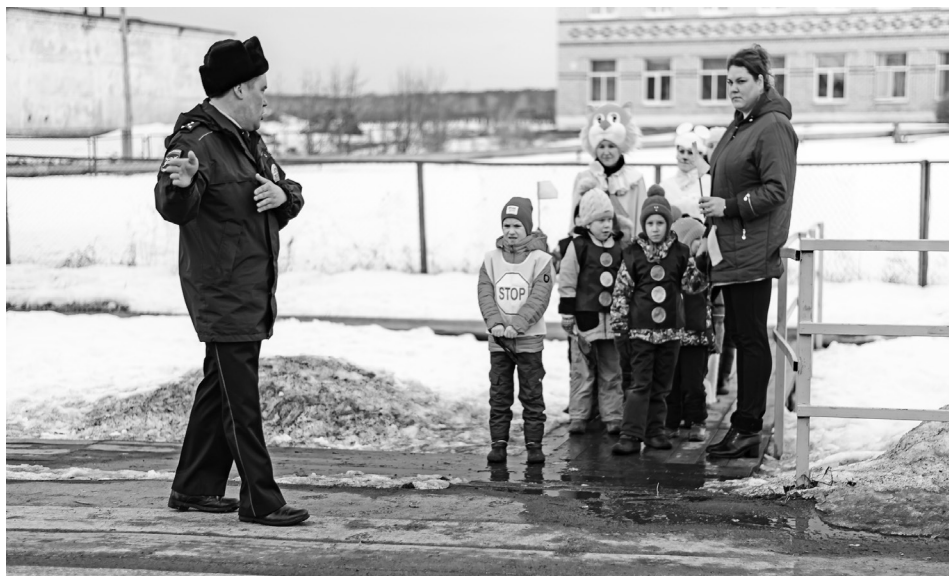
В пути «шагающий автобус».