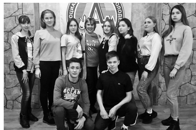
Участники сборов от Байкаловского района.