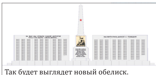
Так будет выглядеть новый обелиск.

Несмотря на должный уход и ежегодные ремонты, памятник находится в аварийном состоянии. Крошится кирпич, из которого он сделан. Летом после празднования Дня Победы намечено строительство нового мемориала. На эти цели из областной казны уже выделено 2,5 миллиона рублей. Через несколько месяцев нижеиленцев ждёт новый обелиск.