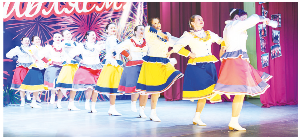
Прекрасным номером порадовала танцевальная группа «Овация».

В этот незабываемый вечер всюду звучала музыка, были организованы выставки достижений участников художественной самодея-