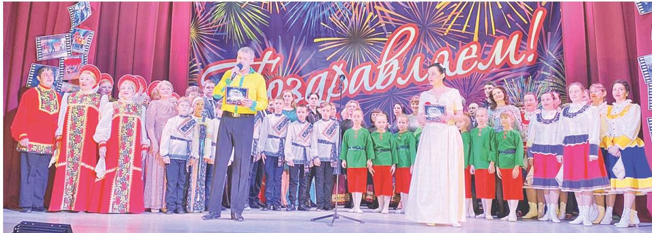
Сотрудники ЦДК со своими талантливыми коллективами тепло встретили гостей.