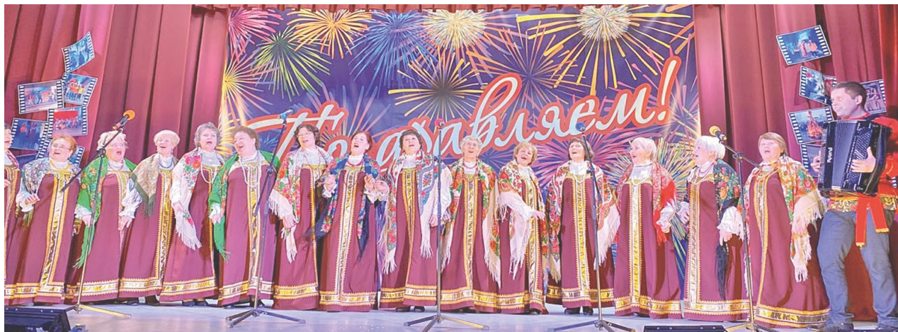
Блестяще и торжественно выступил Народный хор ветеранов.