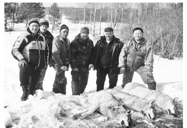
Участники охоты на волков 13 марта.

С. КОШЕЛЕВ, госинспектор Департамента по контролю и регулированию животного мира.