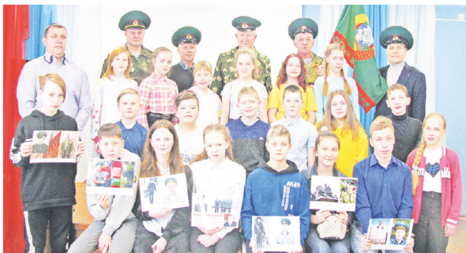
бг класс в полном составе на встрече с почётными гостями.