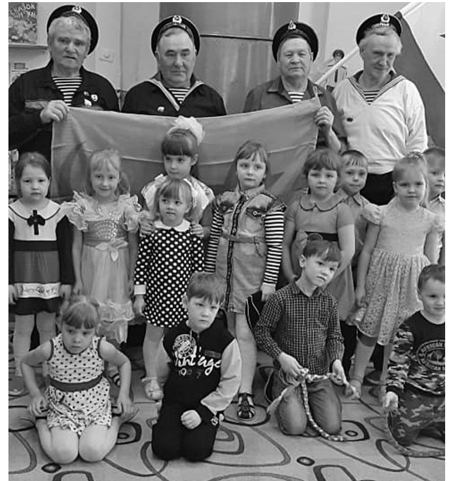
Встреча дошколят с настоящими защитниками Отечества.