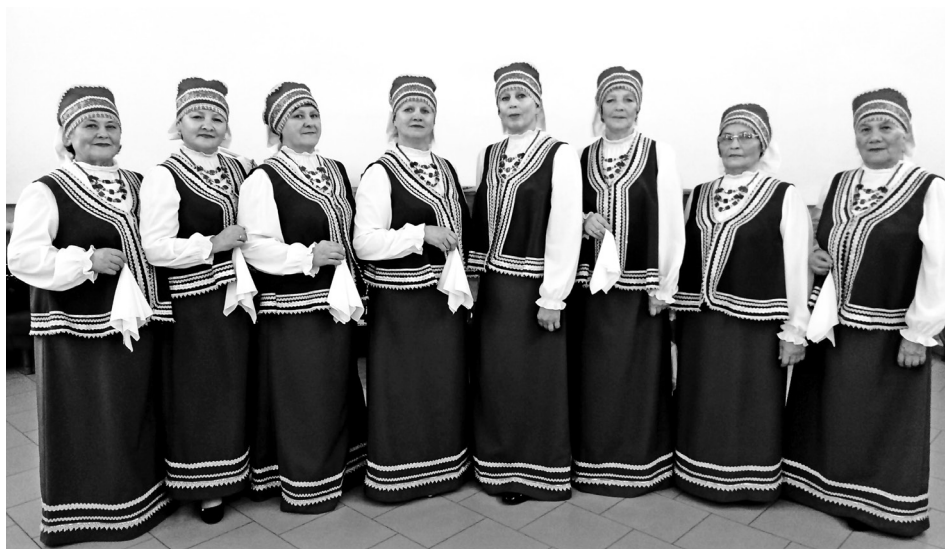
Фольклорная группа «Соседушки».