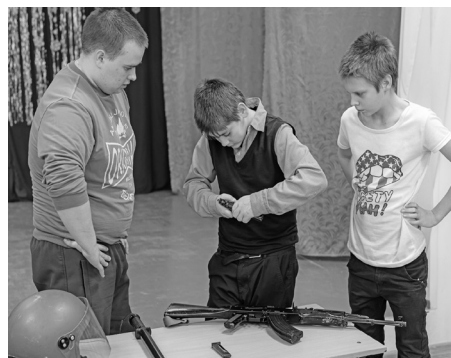
Дети попробовали разобрать и собрать автомат Калашникова, пистолет Макарова.