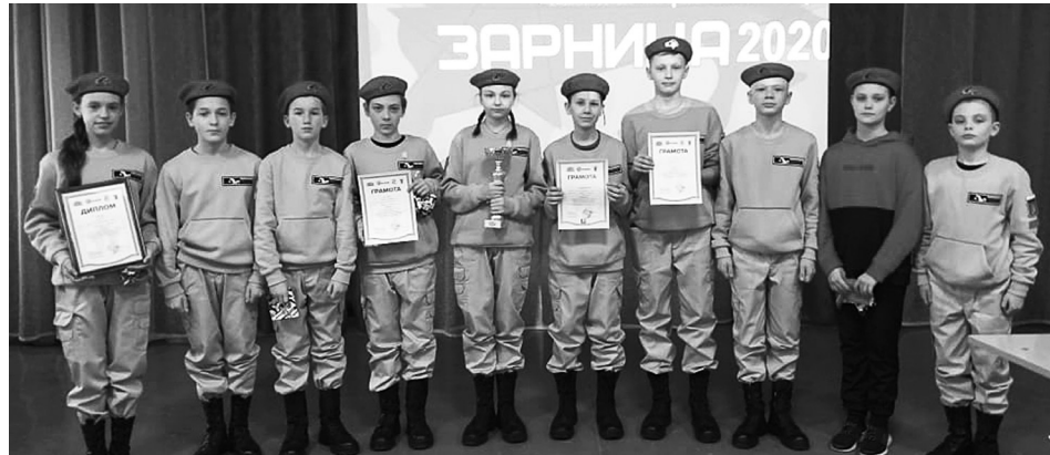
Будущие защитники Отечества целеустремлённо шли к финишу.