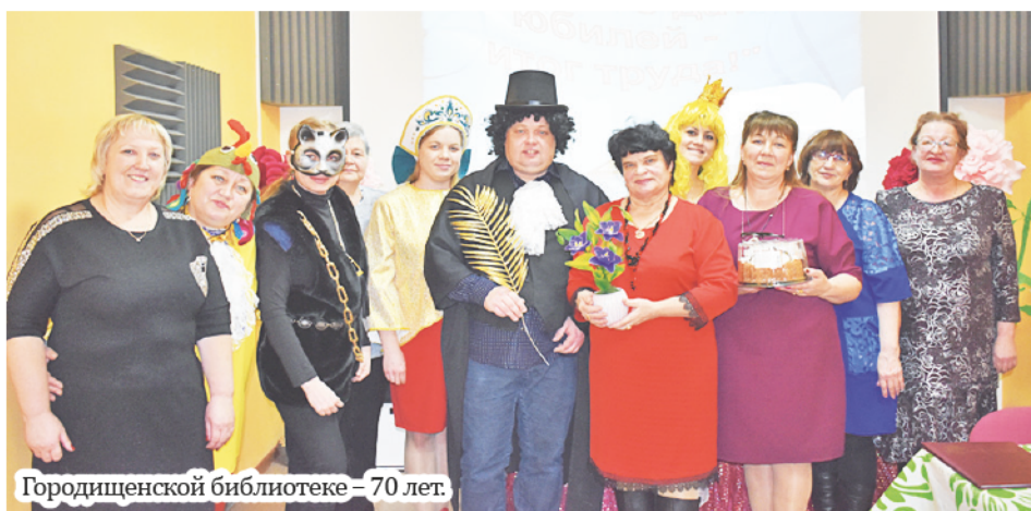
Городищенской библиотеке – 70 лет.