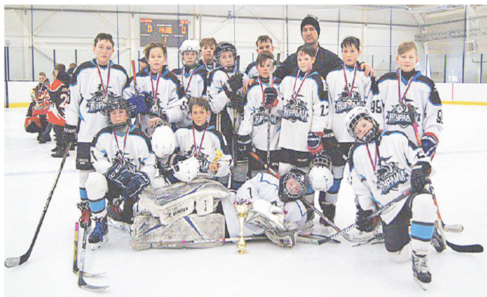
«Стальные журавли» – вторые в области.

Соперником байкаловцев в стыковых матчах за выход в финал стал «Факел» из Лесного, занявший второе место в дивизионе «Север». В гостевом матче наши парни «вынесли» хозяев – 8:3. В упорном домашнем поединке вырвали победу со счётом 3:2. Казалось бы, добро пожаловать в финал, но не тут-то было. Начались интриги, жалобы. Таковы реалии «большого» спорта, где не всё решается на льду, площадке, ковре... Представители Лесного подали протест на результат домашней встречи, они не могли успокоиться, что их переиграла сельская команда. Поводом стала регистрация нового игрока. Федерация хоккея Свердловской области приняла сторону «Факела», доводы «Журавлей» услышаны не были. Результат встречи аннулирован. Назначен третий матч на нейтральном