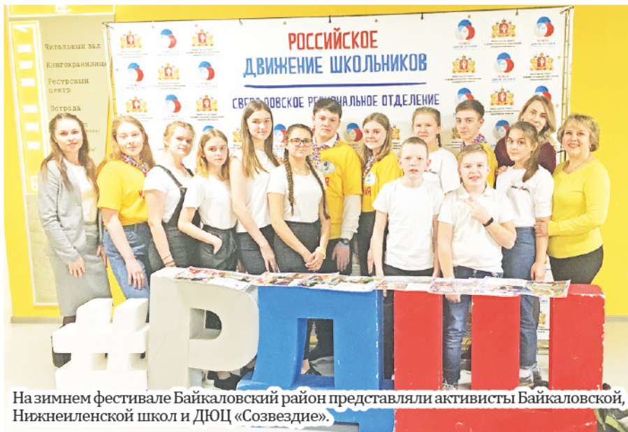
На зимнем фестивале Байкаловский район представляли активисты Байкаловской, Нижнеиленской школ и ДЮЦ «Созвездие».

На торжественном открытии всех приветствовали заместитель полномочного представителя Президента Российской Федерации в Уральском федеральном