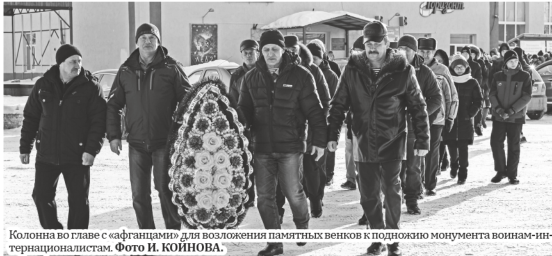
Колонна во главе с «афганцами» для возложения памятных венков к подножию монумента воинам-интернационалистам.