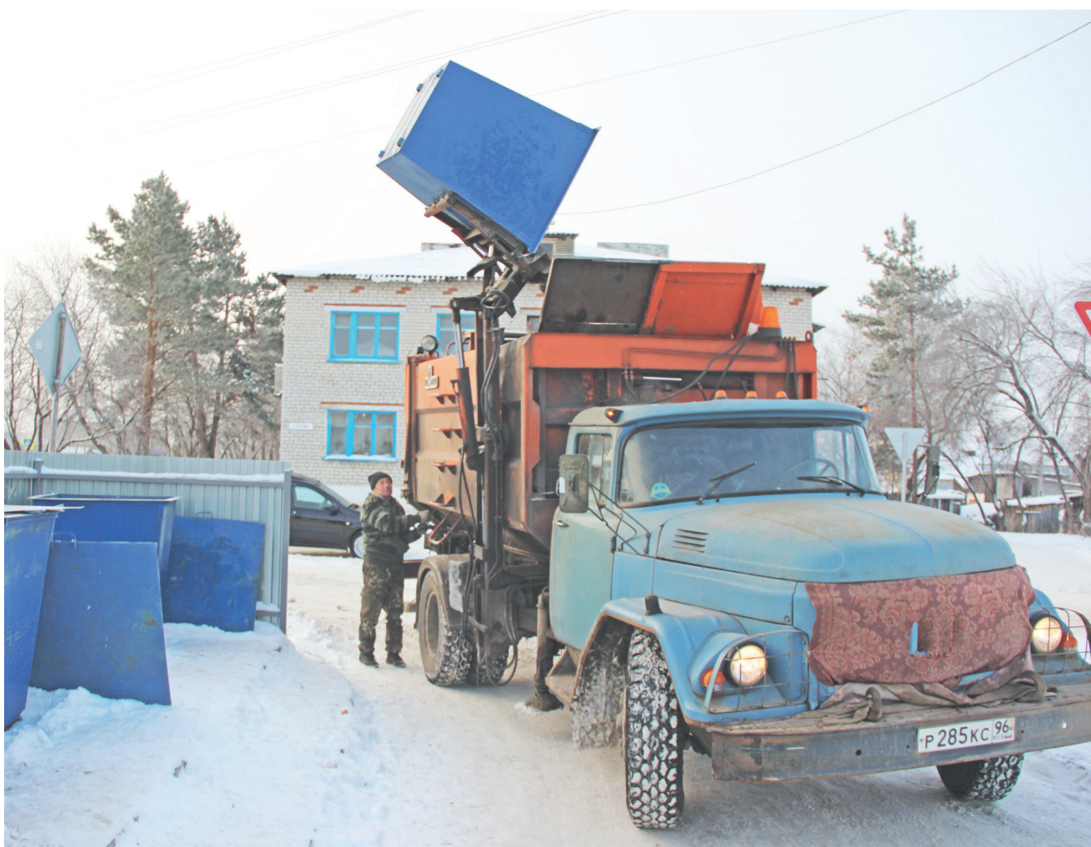
В нашем районе вывозить мусор и бытовые отходы, как и прежде, будет ООО «Трансмастер», только от имени «Спецавтобазы».