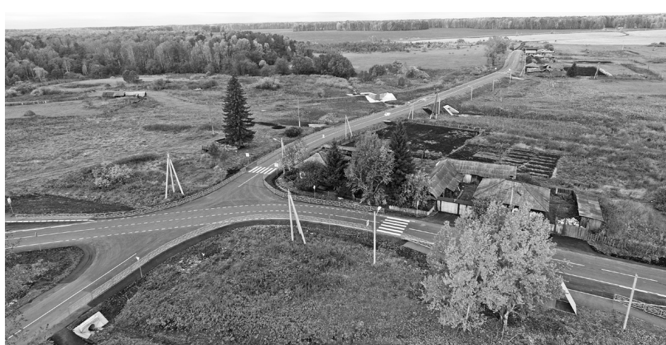
По асфальтированной дороге жители д. Калиновка могут передвигаться в любую погоду.

По ставшей уже доброй традиции мелиостроевцы вкладывают свой труд в ремонт и строительство многих объектов области, а нередко и за её пределами. В нынешнем году они с успехом работали в Алапаевске и Талице, где также занимались реконструкцией автодорог общего пользования по улицам этих городов, за что были отмечены руководством городского округа. К примеру, новый слой по-