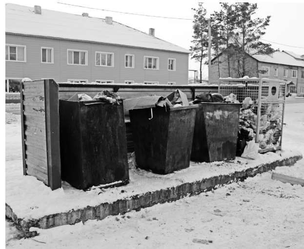
Главное, чтобы мусор вывозили вовремя.

Кроме коммунальных, в сельской местности большой объём отходов от животноводства и растениеводства, строительного мусора. Как быть с ним? Например, картофельная ботва. По правилам пожарной безопасности, сжигать её нельзя. Вывозить на местную свалку также будет запрещено. Тогда остаётся валить в общую кучу прямо посреди улицы? Это будет катастрофа. Разработчики говорят, что законодательством не запрещено региональному оператору заниматься обращением с иными видами отходов. Стоимость определится индивидуально, отдельным договором.