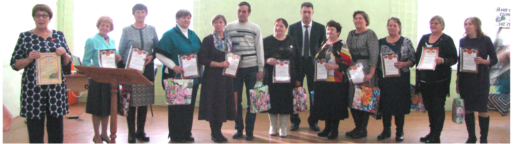
Заключительным аккордом встречи стало вручение почетных грамот активистам ветеранского движения.

На актуальные вопросы сельских жителей ответил и заместитель главы Байкалов-