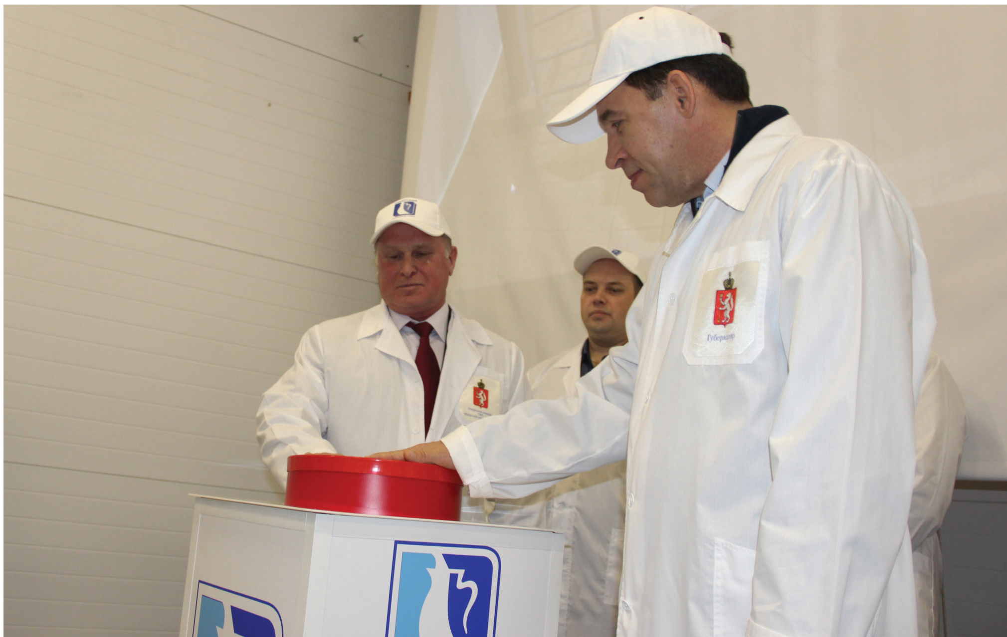
Губернатор Свердловской области Е.В. Куйвашев и генеральный директор Ирбитского молзавода С.В. Суетин запустили цех по производству сухого молока.