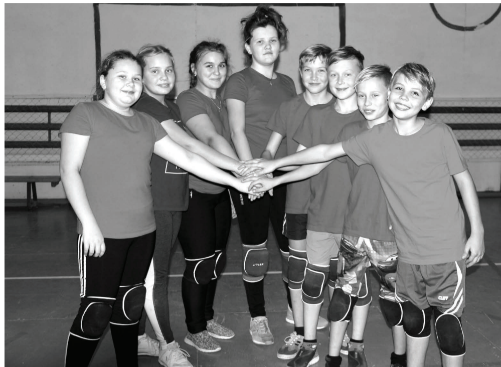
Нижеиленцы на турнире были самой сплоченной командой.

Первыми на паркет байкаловского спортзала вышли нижеиленцы и пелевинцы. Это была самая упорная игра финала. Эмо-