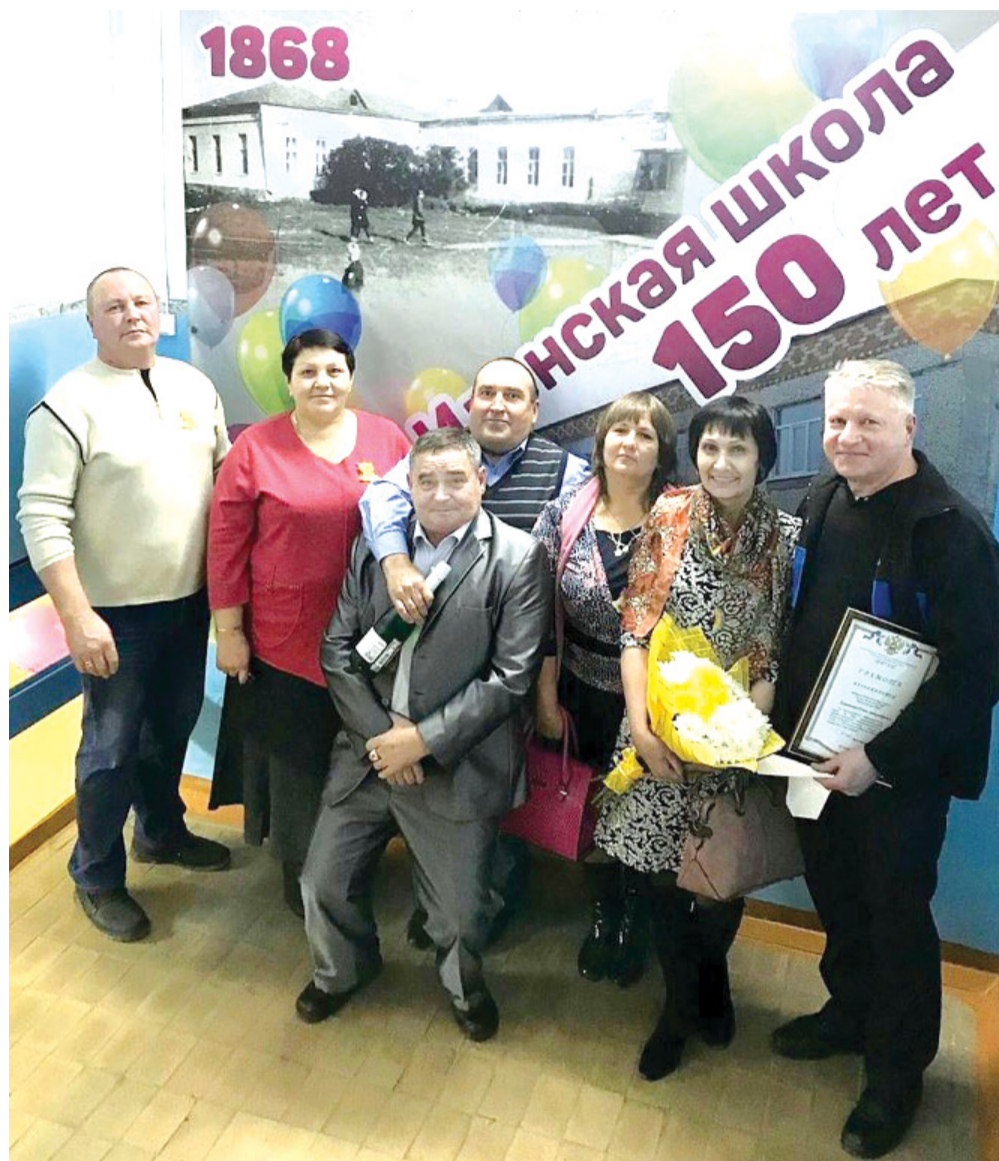
Выпуск 1980 года оказался самым организованным, многочисленным и активным на юбилее родной школы.

И вот – торжественная линейка в спортивном зале. Все выпускники в одной шеренге. «Приступить к сдаче рапор-