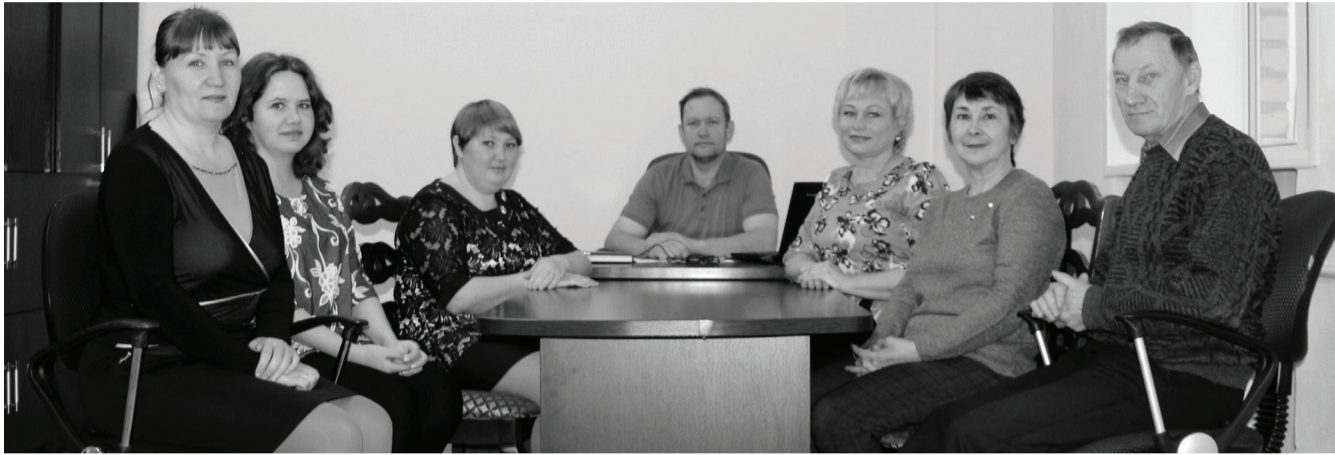
Обновлённый коллектив редакции газеты «Районная жизнь».